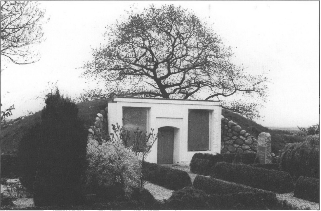
Gravmælet på Folding kirkegård efter istandsættelsen.