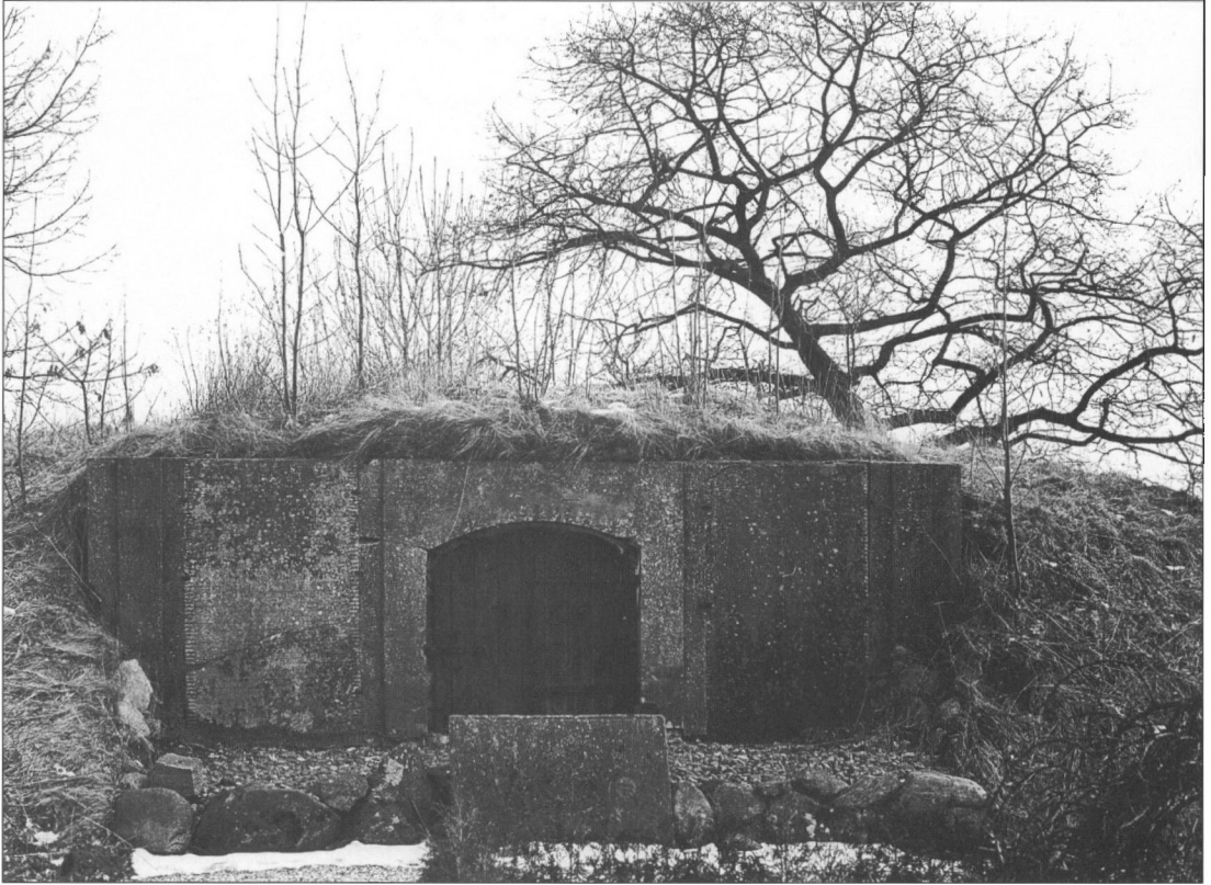
Gravmælet på Folding kirkegård før istandsættelsen 1996.