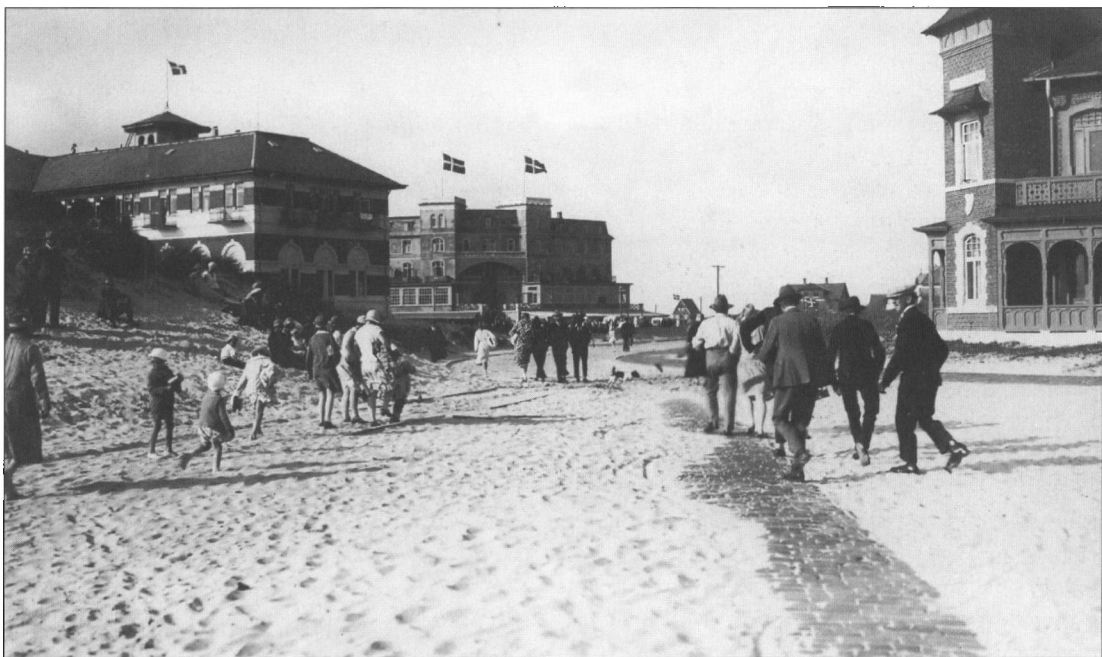
Badevejen ved Fanø Vesterhavsbad med hotellerne i baggrunden, 1930'erne.

I kirkehistorisk sammenhæng er Fanø ikke en geografisk størrelse, men en betegnelse for den begivenhed, der skal berettes om i det følgende.