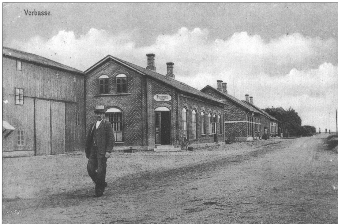
Østergade i Vorbasse med Brugsen i forgrunden.