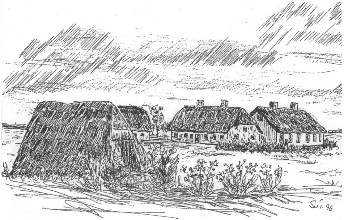
Således kan Vorbasse Fattiggård have set ud i 1879. Tegningen er udført efter skriftlige oplysninger om bygningerne og deres placering.

klare sig ved tiggeri og kriminalitet. Kongen vedkendte sig ganske vist sin pligt til at sørge for de mennesker, der ikke selv kunne klare sig, men han gav opgaven videre til sine lensmænd, biskopper, købstadsråd og præster. Disse mennesker opbyggede en form for organisation for fattigforsørgelsen, men organisationen fik ingen penge at gøre godt med. Fattigforsørgelsen skulle udelukkende ske gennem frivillige bidrag, og de beløb, der kom ind, forsløg kun lidt.