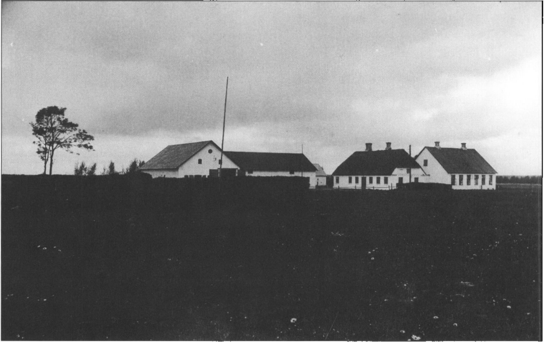
Vorbasse Fattiggård omkring 1920.

merne stadig under bræddelofter og stråtag. Den fare kunne sognerådet ikke leve med i længden, og i 1919 besluttede det »at der skulle opsættes ildfaste klinker over lemmernes soveværelser«. Senere blev stråtaget udskiftet med fast tag.