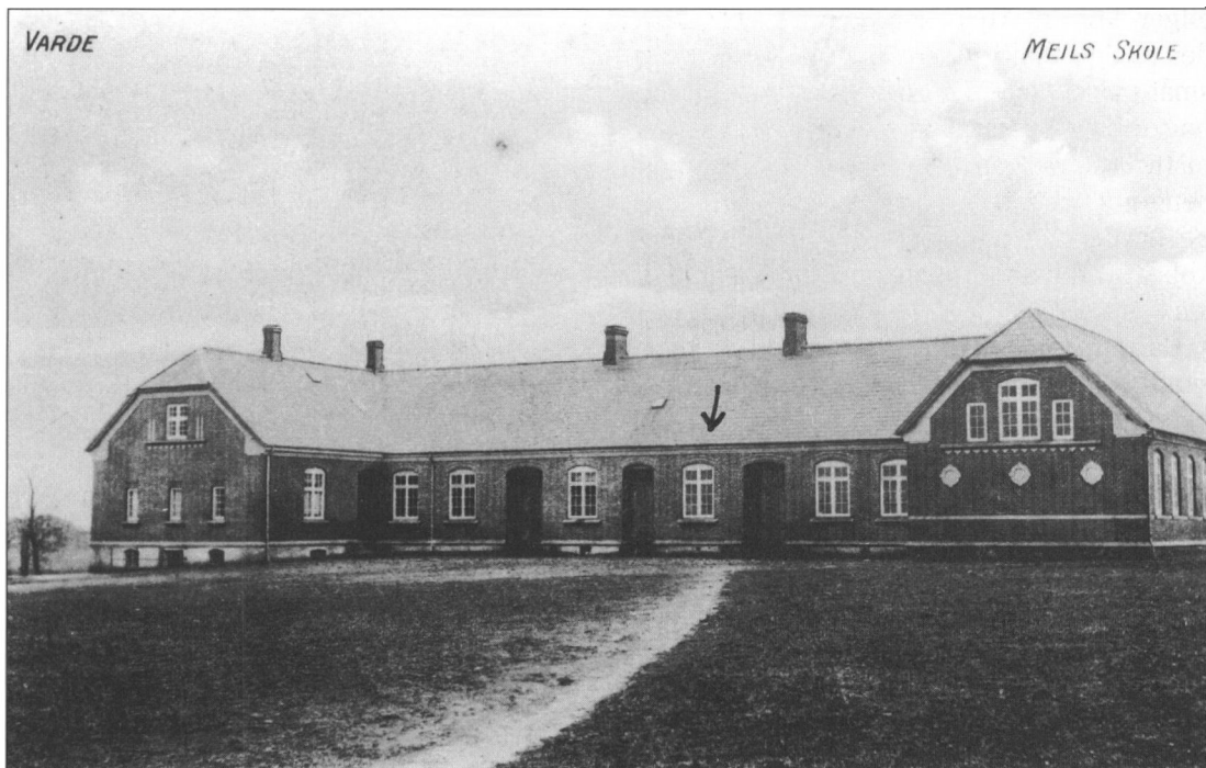
Mejls Skole 1913-42. Udlånet foregik i et lille rum vist med pil på billedet. I 1942 blev skolen udvidet med en ny sal og et rummeligt sognebibliotek.