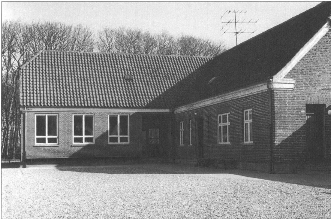
Orten Skole fra 1922. Der blev som til Mejls skole bygget ny sal og sognebibliotek i 1942.

Den 1. april 1973 var det slut. Varde Kommune gik over til bogbusbetjening af landområder, der også omfattede Blåbjerg og Blåvandshuk kommuner. Bogbussen kommer stadig til Mejls en gang om ugen, men bliver nok først og fremmest benyttet af skolebørnene, der har bussen lige udenfor en time om ugen.