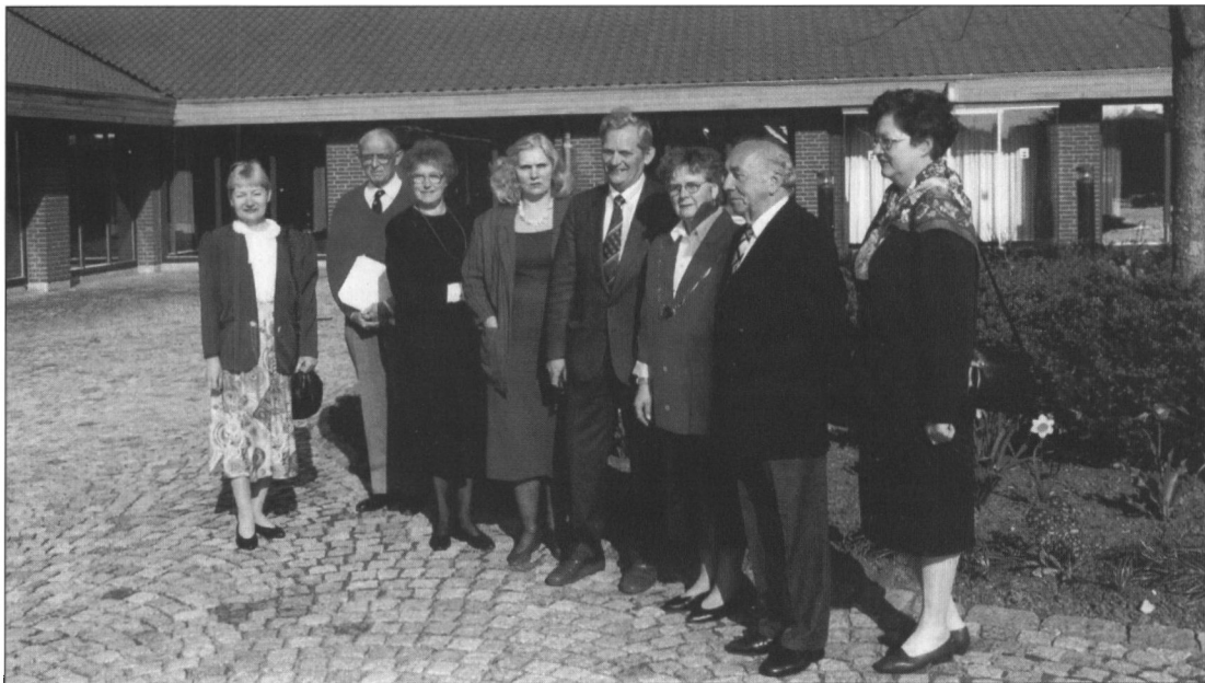
De lettiske og franske gæster blev modtaget på rådhuset den 5. maj 1995.

Arkivet har to store projekter på bedding: En billedhistorie med arbejdstitlen Blåvandshuk kommune i gamle fotos og postkort, 1870-1940, og Flygtningelejren i Oksbøl, 1945-48.