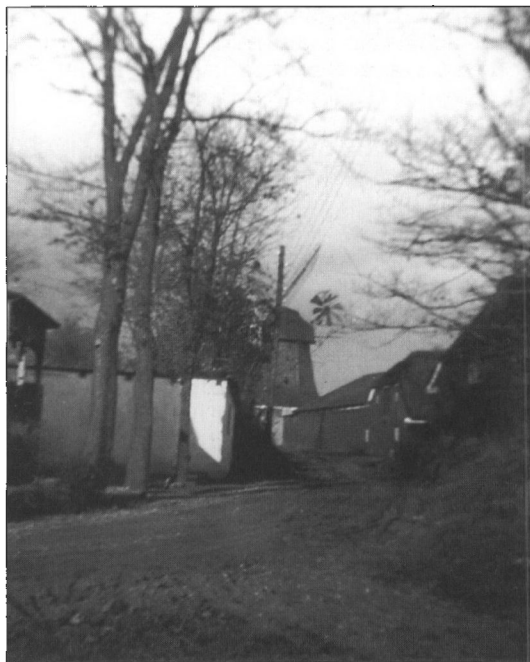
Møllebakken i Store Darum. Møllen blev opført i 1855 og - efter forgæves forsøg på at bevare den - nedrevet i 1965.

Udover det løbende arkivarbejde og besvarelse af henvendelser var 1995 et år, der var præget af flere