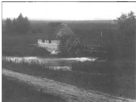
Præstkær Mølle under Gravengård

Femte møde blev afholdt i Foldingbro 29. april 1772 og 30. april 1772 på Sønderskov, hvor birkedommer Fogh endnu ikke havde