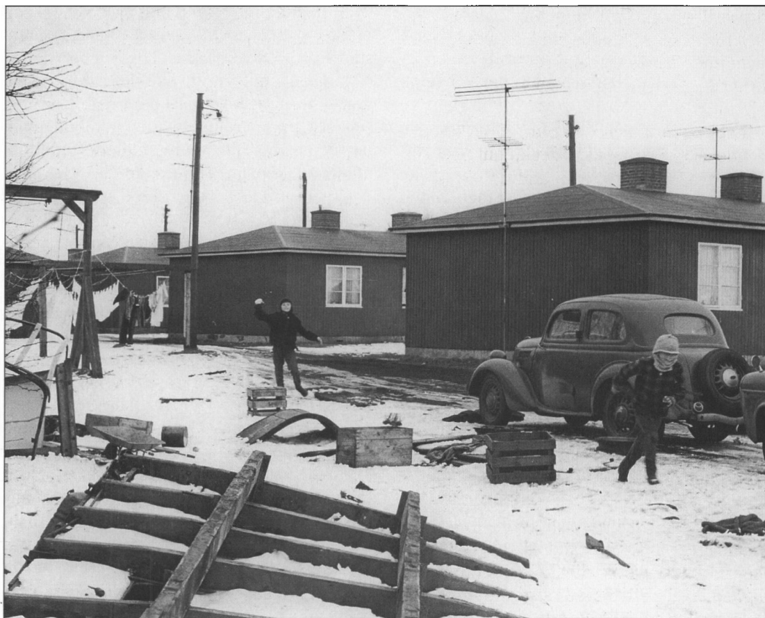
Husvildeboliger ved Ribegades udmunding i Gammelby Strandvej, ca. 1960.

forudsætningen for deres journalistiske karriere.