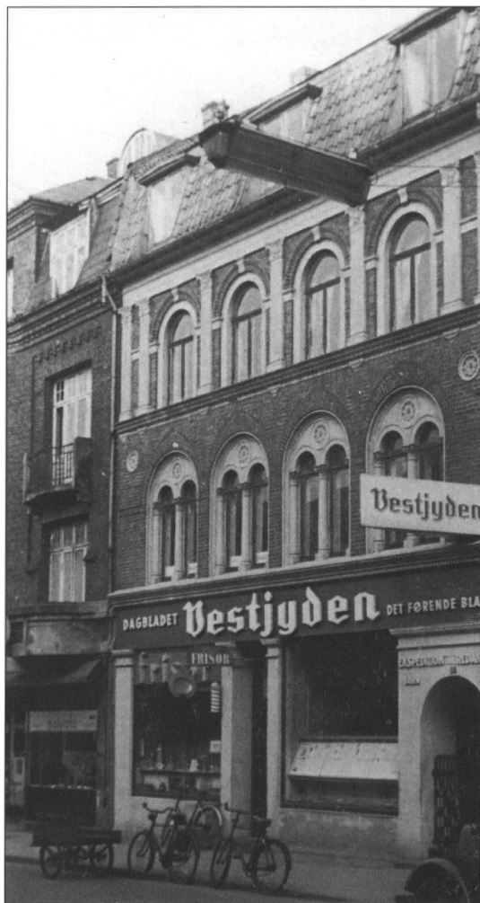
Kongensgade 41, hvor Vestjydens redaktion og ekspedition havde til huse. Billedet er fra ca. 1955.