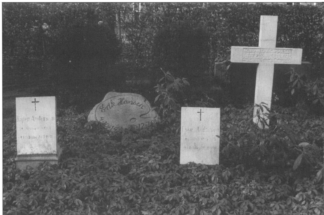
Lapidarium - bevarede gravsten på kirkegården i Gormsgade, Esbjerg.