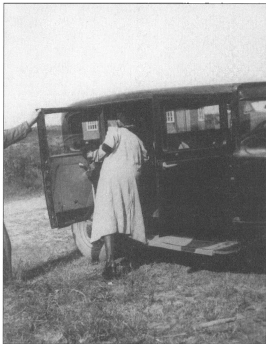
Foto fra 1943 af sørgende kvinde med sorte strømper og sørgelind på ærmet. Den lyse frakke skyldes formodentlig krigstidens mangel på beklædning.

dere, at fra ældre tid stod der nogle metalkors, der har holdt sig fri for rust og i god stand. Der står adskillige endnu på kirkegården (1936), og inskriptionerne viser, at på en enkelt nær er de alle minder over folk fra byen Eg, ca. syv km. vest for Grindsted. Dette viser, at i Eg boede de mest formuende bønder i sognet. »Småfolk har slet ikke haft råd til at anlægge sådanne kors«. Metalkorset blev ikke ved med at være på mode. Der kom en periode, hvor man anvendte cementsten. Der er ingen tilbage af dem. »Hen i halvfemserne«, fortæller J. K. Nielsen, »anvendtes en del sten af Rønnegranit afrundet foroven og med forsiden slebet glat, og her anbragtes inskriptionen med gyldne bogstaver. Et stykke hen i det nye århundrede blev naturstenene