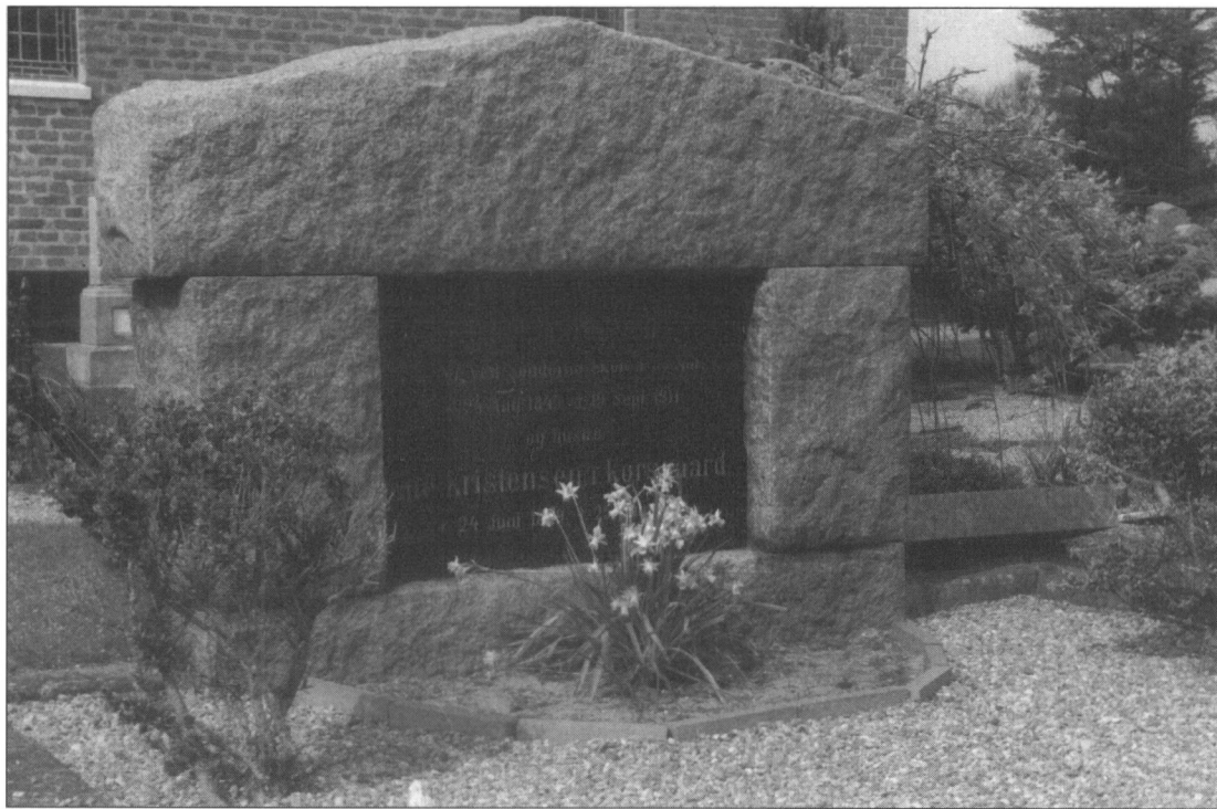
Gravminde på kirkegården i Sønderho af granit med navneplade i sort marmor. På gravstedet ligger en konkylie, og tilsvarende udsmykning findes flere steder på kirkegården - jvf. artiklen i Fra Ribe Amt 1992, s. 424.