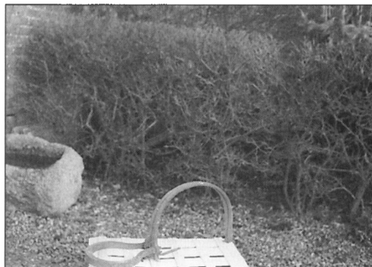
Den stærke rævesaks på gården Karl Jensensvej 7.