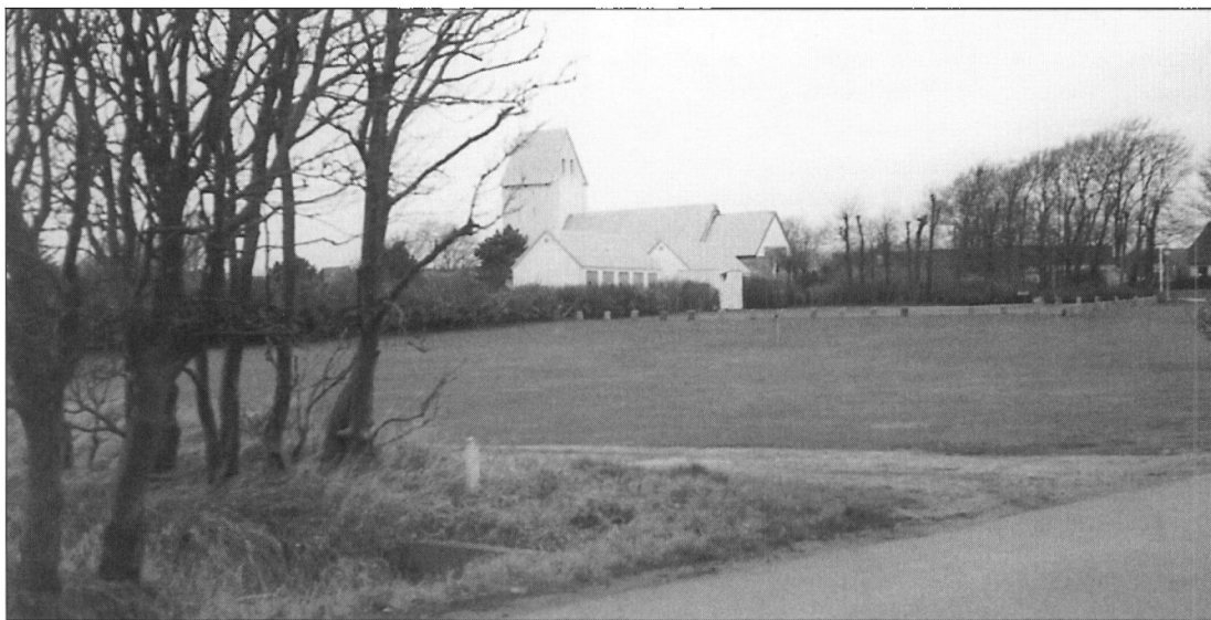
Her på vestsiden af Østre Strandvej er "grønningen sydøst for Kirken", hvor smedehusmændene boede. Bastiansborg lå lidt til venstre for den hvide skelpæl på billedet.