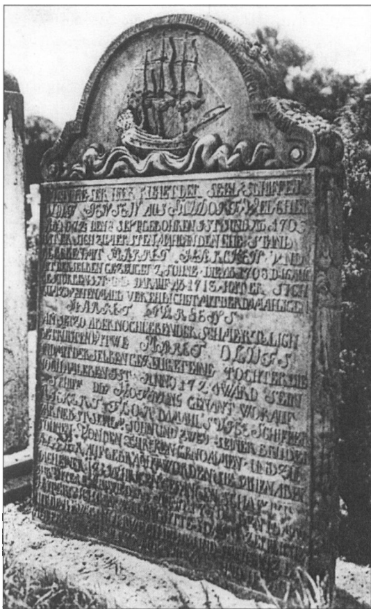
Frisiske gravsten fra Föhr og Amrum.

Deraf fremgår også, at Bastian kort efter branden havde fremstillet sin ulykkelige situation for tinget, og bl.a. nævnt, at laden var faldet sammen, før de selv slap ud af huset, hvoraf man kunne slutte, at branden var begyndt i laden, og ingen af dem havde i lang tid været der med ild og lys. Tillige at sognepresten Chr. Sørensen Sevel havde udstedt