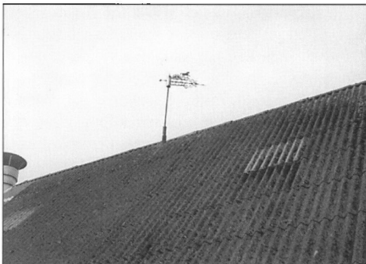
Den gamle vindfløj på gården Karl Jensensvej 10.

Bygningerne tilhørte efter fæstebrevet beboerne. Der er 6 fag til beboelse, 4 fag lade og ko-