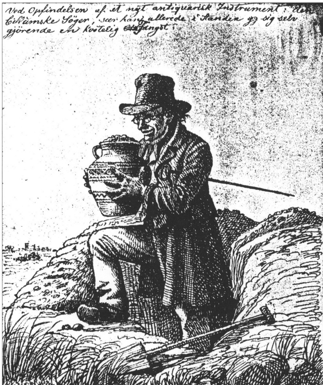
Figur 2. Ved opfindelsen af et nyt antiquarisk Instrument: den billumske Søger, seer han allerede i Aanden sig selv gjørende en kostelig Fangst.