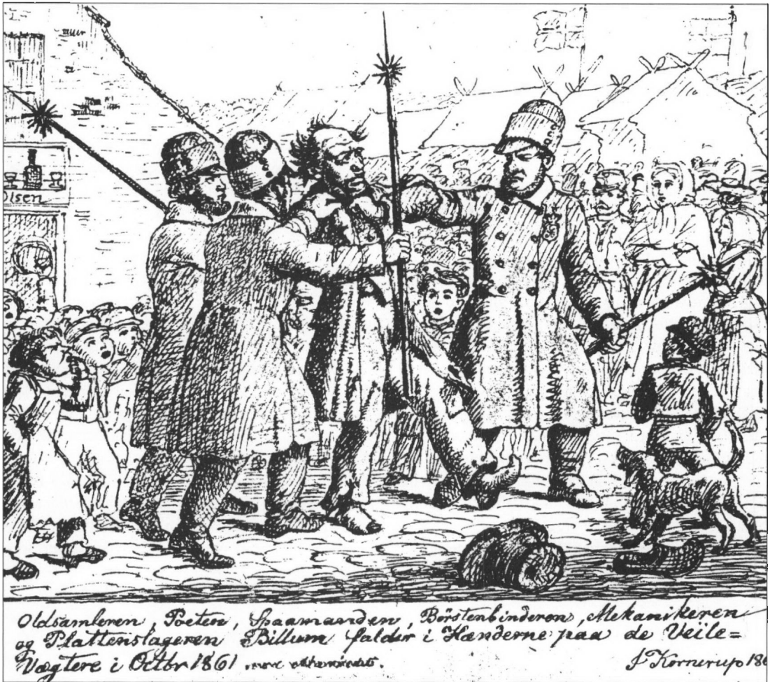
Figur 5. Oldsamleren, Poeten, Spaamanden, Børstebinderen, Mekanikeren og Plattenslageren Billum falder i Hænderne paa de Veile-Vægtene i Octbr 1861.

kone, der boede i værelset lige over stuen med vinduet - en møllebygger Ludvigsens kone ved navn Georgine Jørgensen - at hun ved 3-tiden om natten den 21. september hørte klirren af glas, men hun havde ikke gjort sig nærmere overvejelser herom.