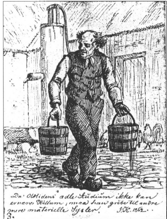
Figur 4 Da Oldtidens ædle Studium ikke kan ernære Billum, maa han gribe til andre mere materielle Sysler.