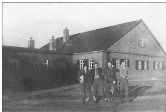
Kostforplejningen, et tidligere lejr-køkken, nu børnehave.

re grønne skjorter og fire grå undertrøjer med lange ærmer og lange underbukser og nogle svære sokker som militærets samt khakifarvede slips. Vi skulle som udgangstøj bruge vort private tøj, for hvilket vi fik 45 øre om dagen i godtgørelse foruden vor løn på kr. 2,25. Kosten var rigelig og efter min mening forsvarlig (der var endnu rationering). Der serveredes en masse brasekartofler, hvori der blev puttet allehånde madrester såsom spegepølse og bajerske pølser, der kunne blive kulsorte og hårde. Flæsket var efter nogles mening lidt for fedt.