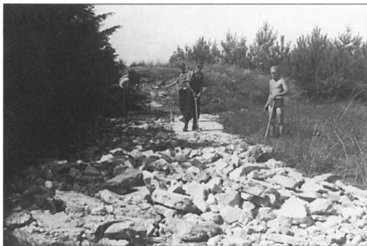
Betonvej brydes op.