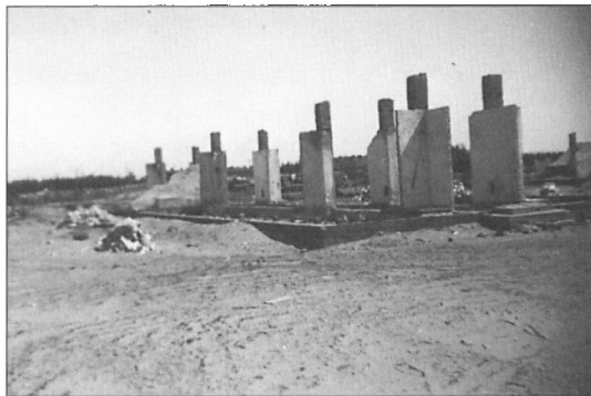
Ikke brandtomt, træet er blot fjernet.

Vi blev vækket kl. 6 om sommeren og lidt senere om vinteren, og vi skulle være i seng kl. 23. Vi kunne få nattegn omtrent så tit vi ønskede det, ligeledes lørdag-søndags orlov, når vi ikke havde gjort os for uheldigt bemærket.