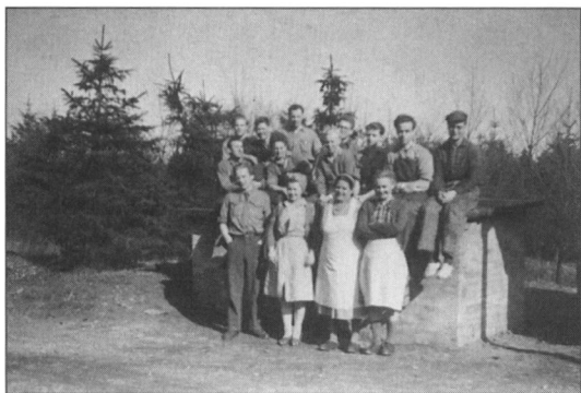
Det var nødvendigt med kvinder, her køkkenpersonalet.