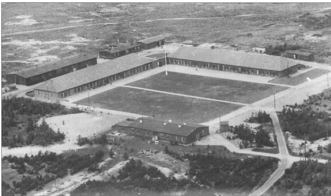
Luffoto af lejren.