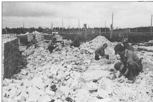
Her håndrenses stenene med murerhammer