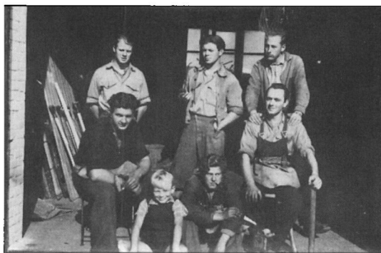
Pause på værkstedet.

Det var jo egentlig en genbrugsvirksomhed. Det udtryk brugte man bare ikke dengang. Men gen-