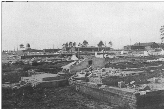
Murede fundamentter fra barak.