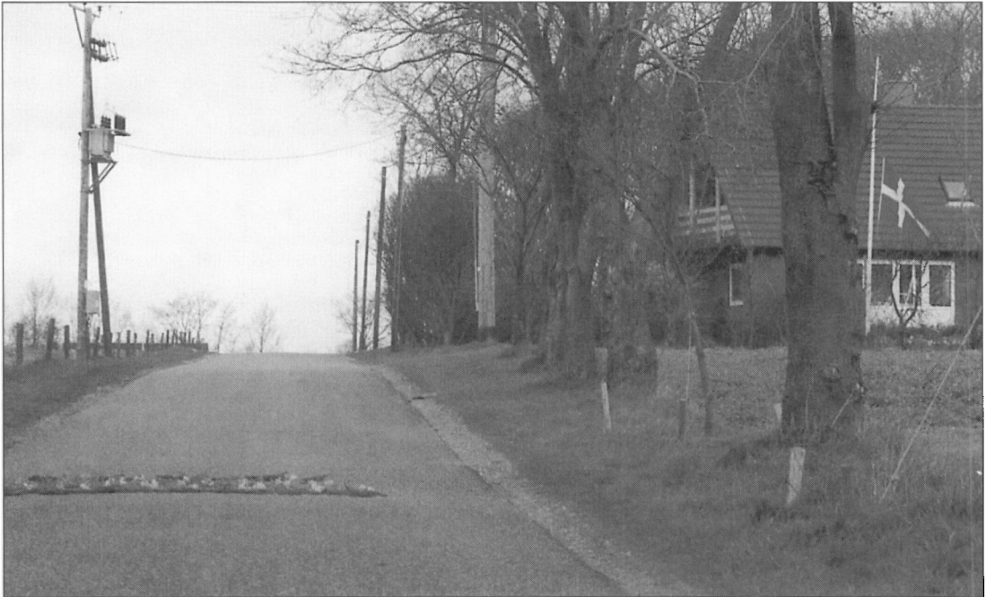
Der er strøet blomster på vejen som en sidste hilsen fra naboerne ved en begravelse i i Sdr. Hygom.

Hvis man skal nævne noget andet, hvor man kan iagttage en nedtrapning af begravelsesskikke, må det være ærbødigheden over for den døde i ligtoget. Fra mine egne barndomsdage i Grindsted kan