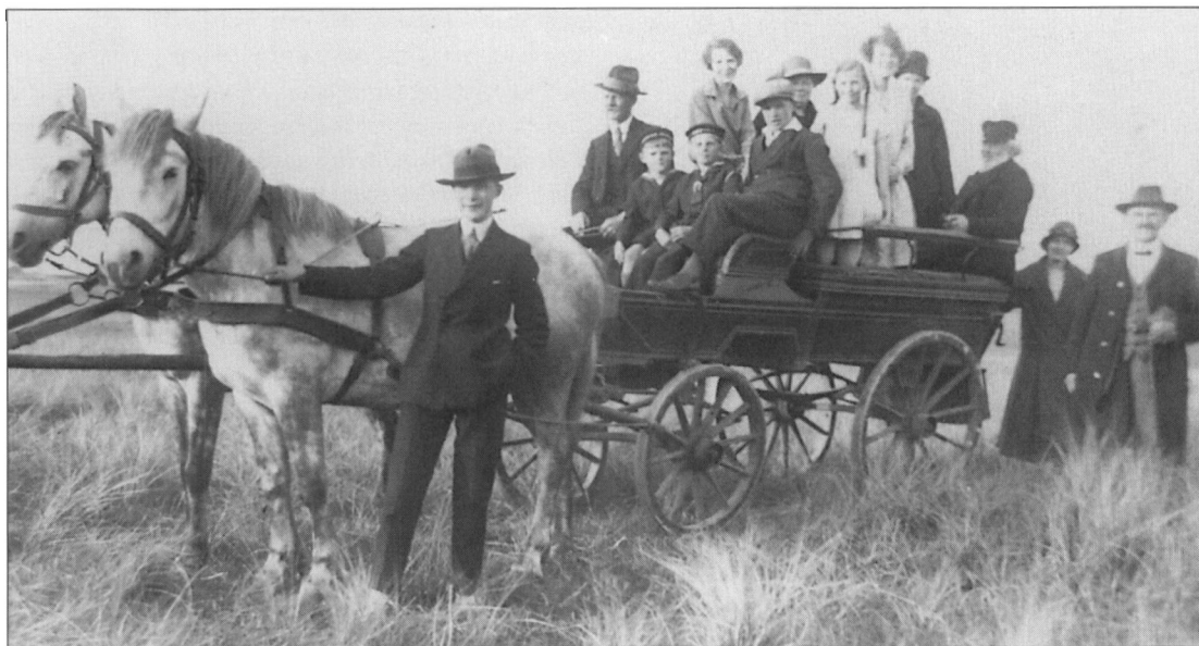
▲ Denne vogn som almindeligvis blev benyttet som stadsvogn, blev også anvendt som ligvogn. Blot tog man sæderne ud. Vognen var i brug som ligvogn indtil 1965. I dag er vognen skænket til "Fonden gamle Sønderho". (Foto i Sønderho-arkivet).

Buick rustvogn fra begravelsesfirmaet C. Bjerregård. Vognen blev benyttet 1937-1951. (B 13175. Esbjerg Byhistoriske Arkiv) ▼