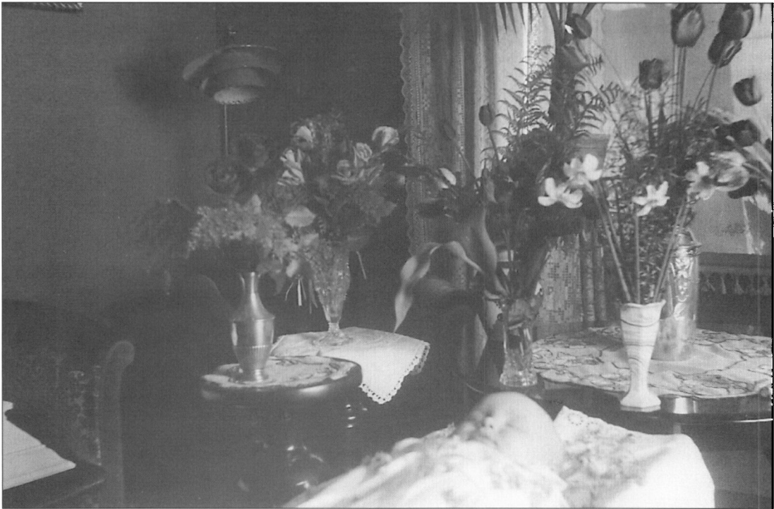
Et barn ligger på ligbåre.

liget, lagde det på strå på et bord, og indbød byens børn til at se liget».