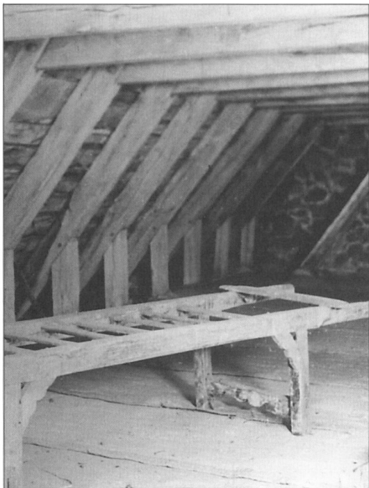
Den gamle ligbåre på kirkeløftet i Aastrup.

budt en lille drink, var Thuesen noget usikker overfor.