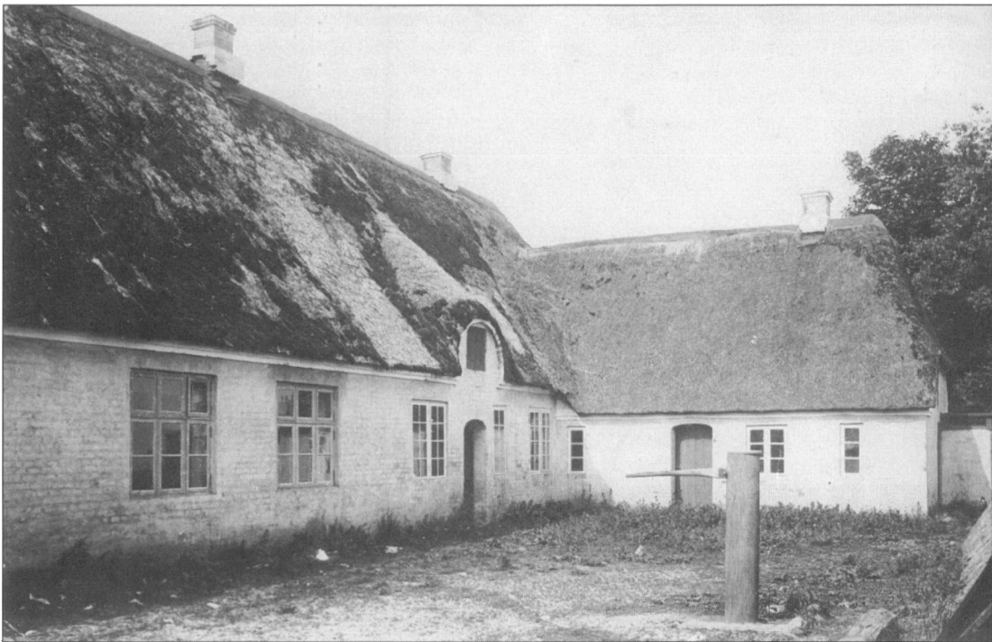
Hunderup Skole ca. 1900. Skolebygningen, som er Hunderups første, er fra 1842. Den bestod af en skolestue og en lejlighed til en ugift lærer. I 1848 blev skolebygningen udvidet, og samtidig blev der bygget et udhus til stald og klynehus. (Foto i Hunderup Sognearkiv).

fra det blev bygget i 1884 og 100 år frem. En »Mejerihistorie« er skrevet af Ejnar Jensen, tidl. forstander på Ribber Kjærgård, og optaget i lokal historisk årbog for Bramming Kommune 1992.