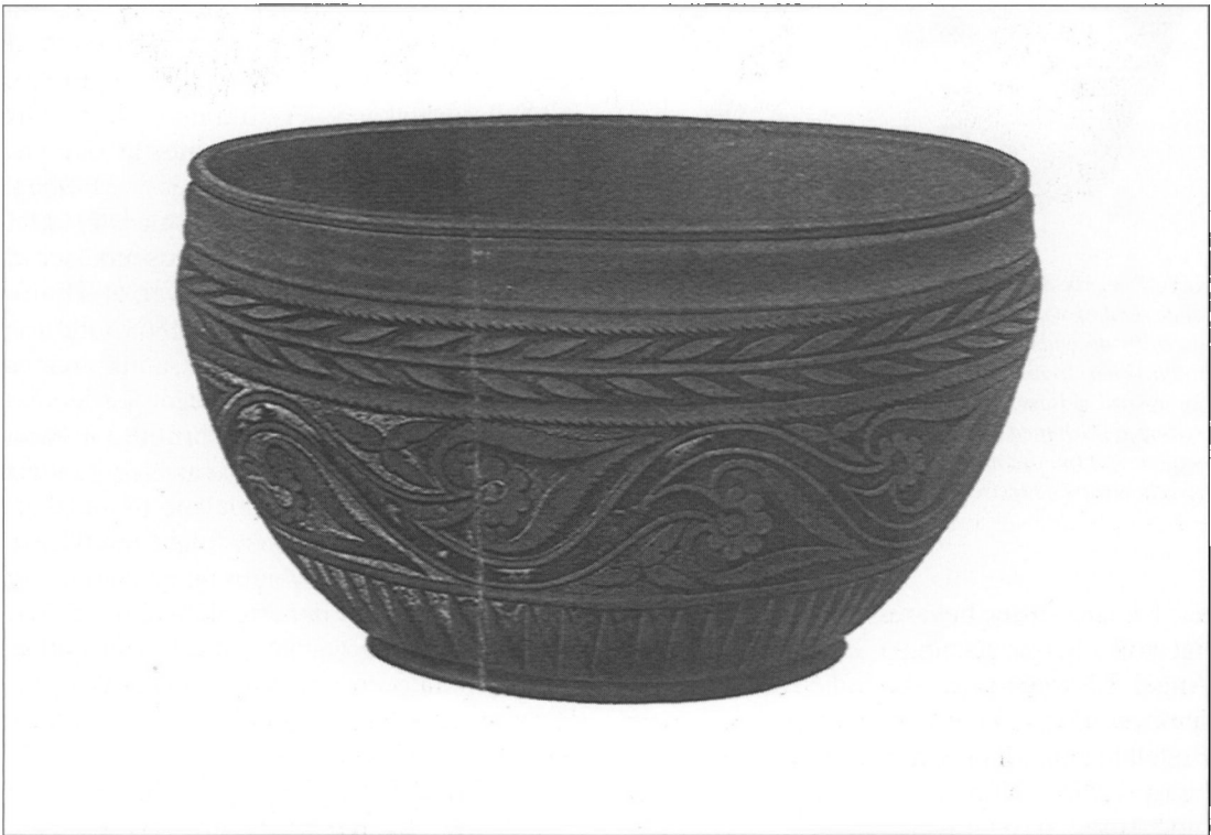
Skål fra Maltbæk mose, fundet i 1867. Efter Årbøger for nordisk Oldkyndighed og Historie 1868.

Intensiveringen af tørvegravningen i forrige århundredes midte er baggrunden for de mange gode oldtidsfund fra moser. Fundene var ovenikøbet som regel usædvanligt velbevare-