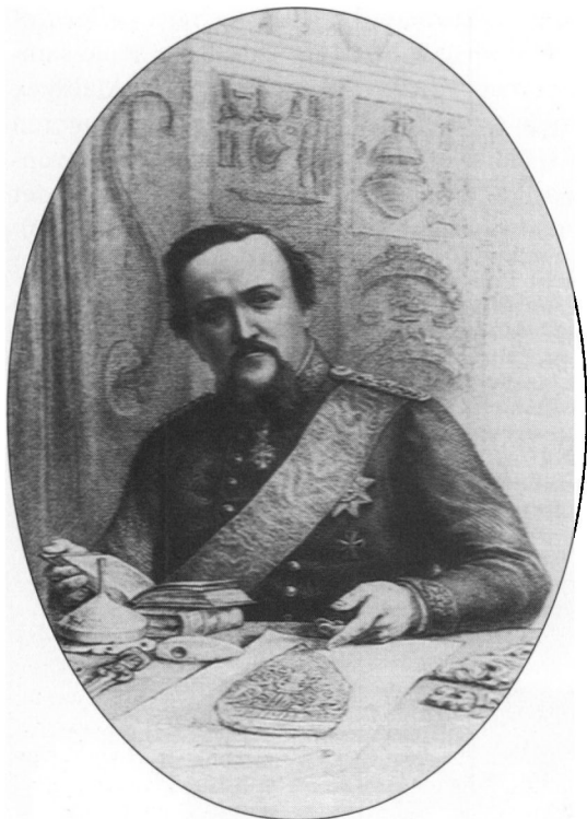
Kong Frederik den 7. ved sin anden oldsagssamling. Den første samling var gået til ved Christiansborgs brand natten til den 18. december 1859. I baggrunden indtager Luren fra Maltbæk en dominerende plads på gavlen af udstillings-skabet med oldsager. På bordet foran majestæten ligger en tegning af siden med kristusfiguren fra Jelling, som kongen synes at vise frem sammen med de få bemalede træstykker fra Jellingundersøgelsen i 1861.