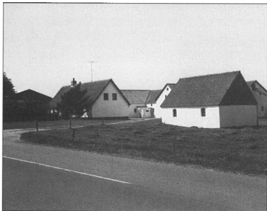
»Lindegaard«, matr. nr. 3, St. Almstok.

på andre måder kunne være en fordel, men jernet skulle jo altså hentes.