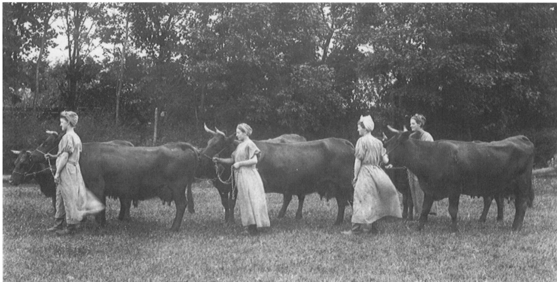
Husdyrholdet på Baungård Landbrugshusholdningsskoles 1. hold i sommeren 1907.