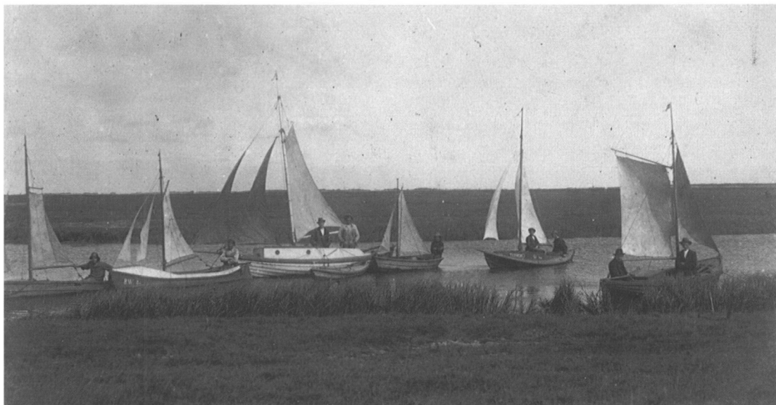
Både i Sneum Ås udløb i 1920'erne.

Gørding Sognearkiv har i det forløbne år haft 58 besøgende plus skoleklasser. Vi har haft nogle skriftlige henvendelser, modtaget ca. 20 afleveringer og stillet materiale til rådighed for en HH-klasse fra Vejen Handelsskole.