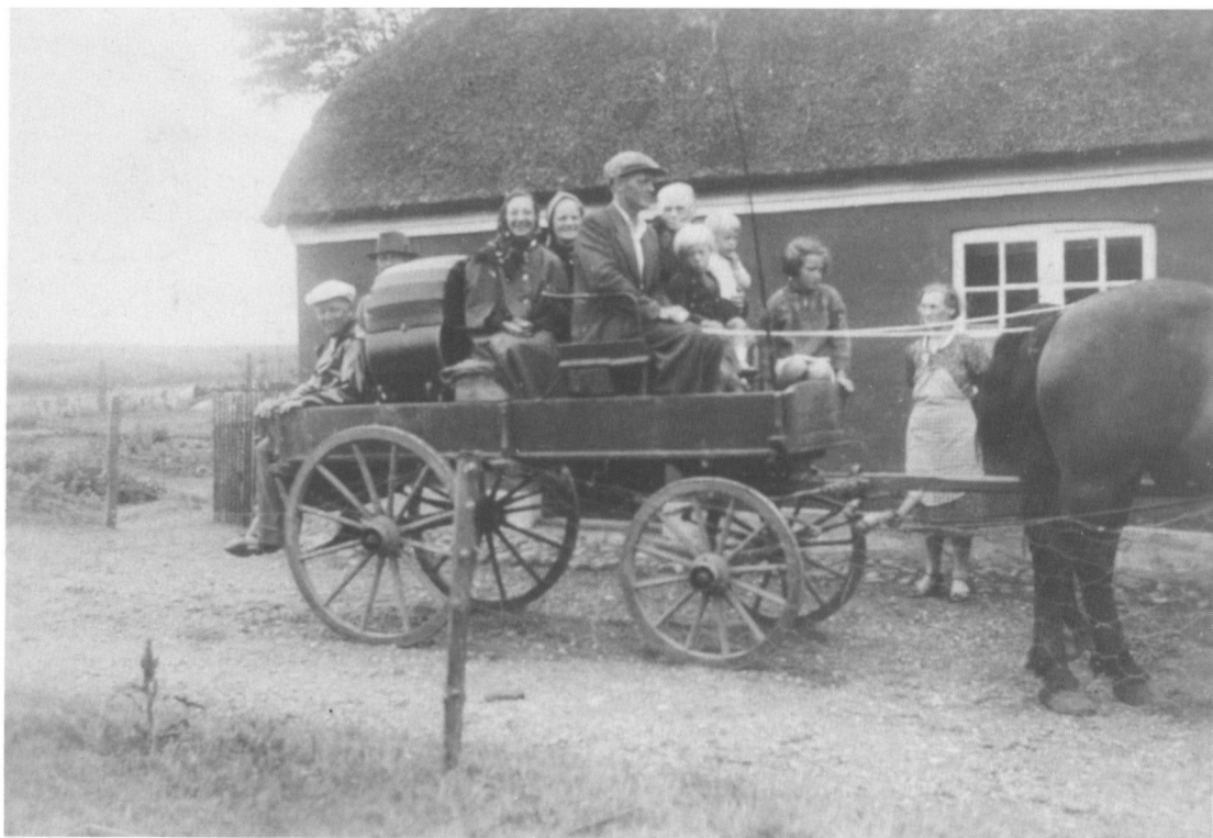
Familien Hansen med børn og gæster på familibesøg i Bryndumdam under besættelsen.

Vi forsøgte bl.a. selv at lave kartoffelmel. Man kunne leje en maskine til formålet. Forsøget faldt dog ikke heldigt ud. At lave sødemiddel af sukkerroer prøvede vi også en enkelt gang. Det blev nærmest en slags sirup, men resultatet stod ikke mål med anstrengelserne.