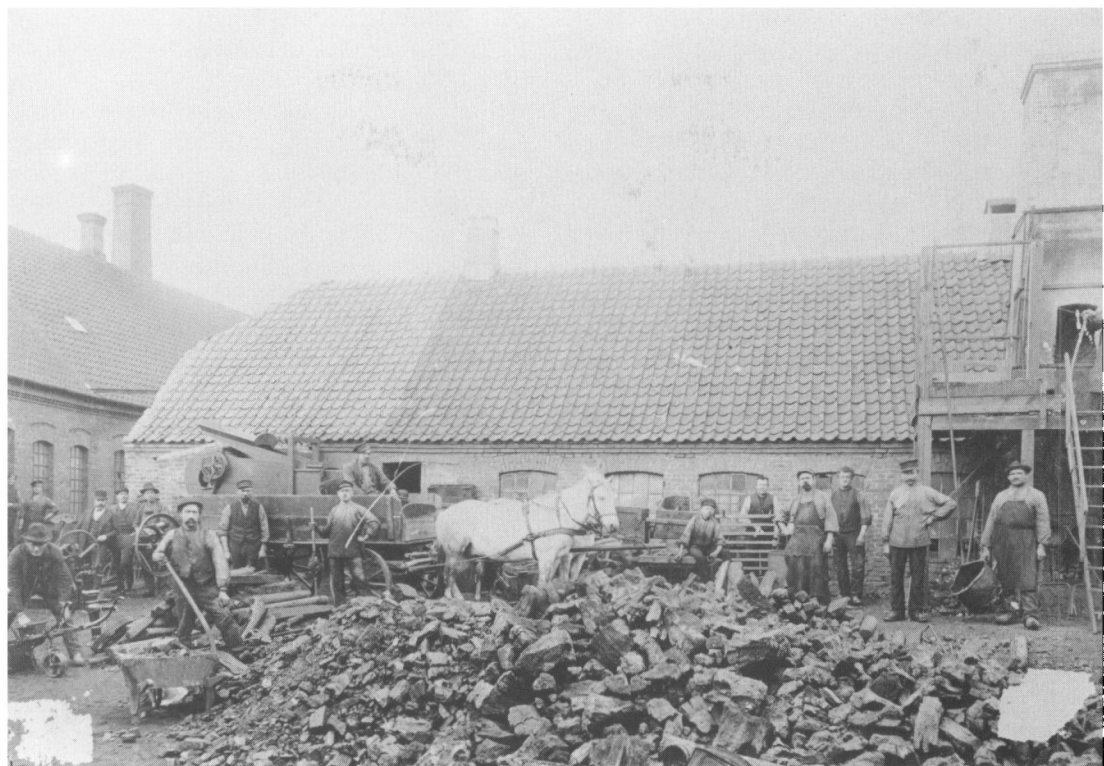
Gårdspladsen ved Birchs jernstøberi. På pladsen ses en del mennesker, formodentlig de ansatte, en masse kul og nogle af de produkter, støberiet fremstillede. Foto fra før 1. verdenskrig.

også til at gælde i Varde. Dens betydning lå i, at den byggede på minimallønssystemet og indførte ordningen med tillidsmænd. Endvidere blev medlemsbog til forbundet anerkendt som bevis på, at en arbejder var faglært. Denne overenskomst kom til at danne mønster for alle senere overenskomster mellem smedene og deres arbejdsgivere. Dens bestemmelser udsprang af den opfattelse, at arbejde og kapital grundlæggende havde de samme interesser. Det fælles mål var, som det var formuleret i indledningen til overenskomsten, at den danske jernindustri skulle udvikle sig på en sund og rolig måde . Og dette mål nåede man bedst, hvis de to parter samarbejdede loyalt.