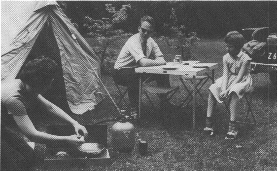
På campingtur ca. 1960. Et af billederne fra Esbjerg Byhistoriske Arkivs udstilling "Moderne tider i Esbjerg".