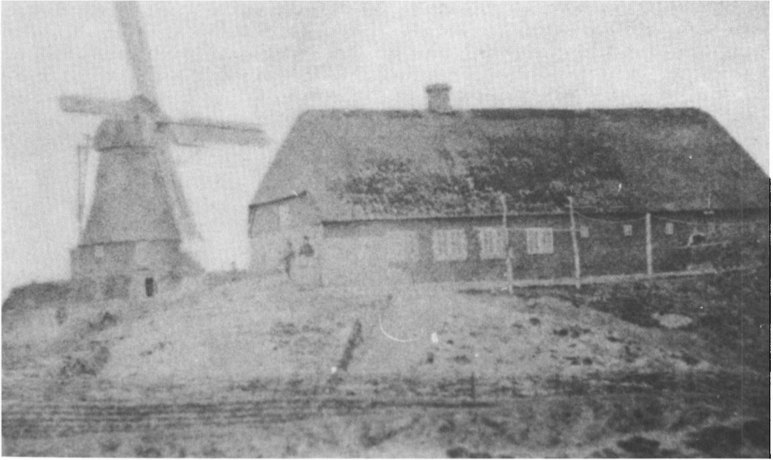
Darum Mølle og Møllegård 1864.