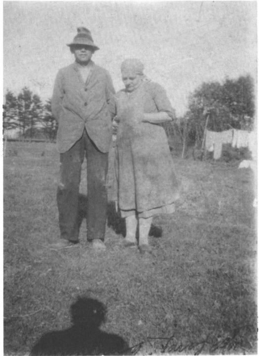
Min far og min mor på en vaskedag i 1928.

Friskolen, som jeg før har skrevet om, var