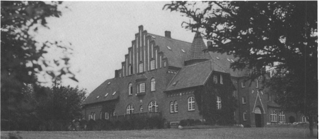
Kerteminde folkehøjskole 1937.