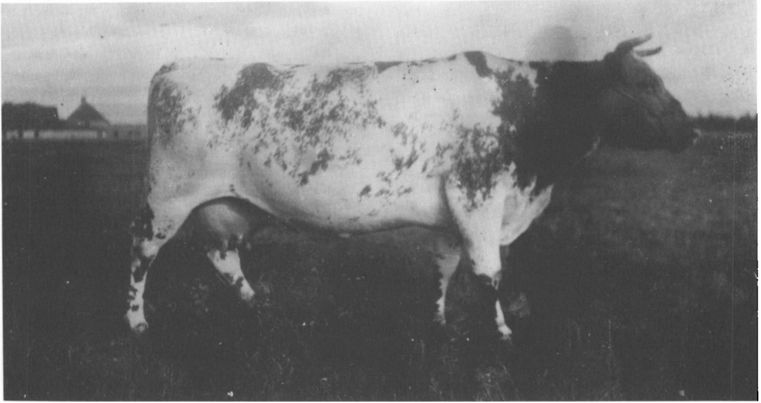
Gårdens bedste korthornsko »Stjerne« (1930). (Privateje).

ikke af pengemangel, men fordi han ikke ville forarge sine økonomisk trængte standsfæller.