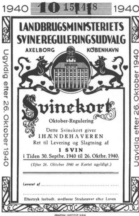
Svinekort fra 1940.

Privat selskabelighed var ikke overvælden-