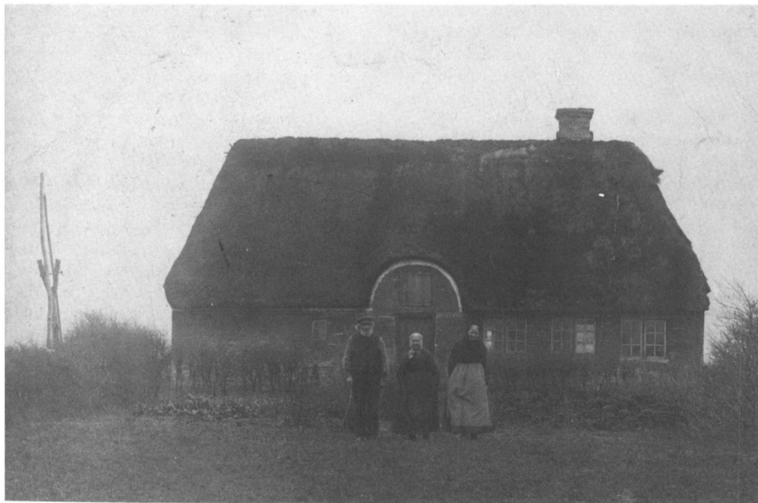
Et af de små steder i Faurlund, bygget af genbrugsmaterialer. Læg mærke til de uens store vinduer og den gammeldags vippebrønd. Personerne er uidentificerede.