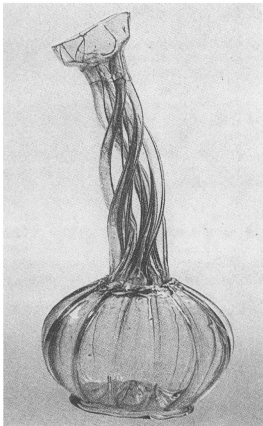
Fig. 5. Kuttrolf , antagelig fra 1500-årene. Nu i Kulturen, Lund. Ef. Kjellberg 1958.

I Franz Rademachers bog Die deutschen Gläser des Mittelalters fra 1933 er på grund-lag af nogle få eksemplarer opstillet en udvik-lingsrække for Kuttrolf -flaskerne med rødder helt tilbage i romersk glasindustri. En flaske, der helt svarede til vores, kendte Rademacher tilsyneladende ikke, så det var højst en for-nemmelse af, hvorhen den videre eftersøg-ning skulle gå, der kunne hentes i hans værk. At flaskerne ofte brugtes til brændevin, frem-går imidlertid af omtalen af dem i skriftlige