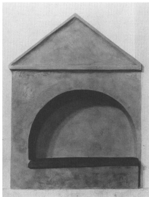
Fig. 3. Nichegraven i Ribe domkirkes nordre tværskib. Genbegravelserne af de tre Ribe-bisper er under den mørke stenplade i bunden af nichen. Foto: Lennart Larsen. Ef. Danmarks Kirker, Ribe amt.

Tanken bag anbringelsen af helgenlevn i de middelalderlige bygninger må være et ønske om at tilføre kirken kraft og værn fra de helli-