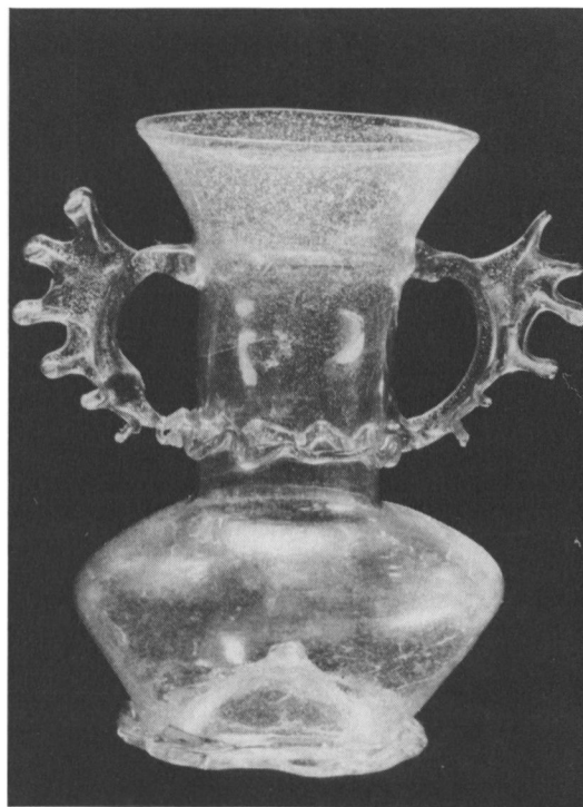
Fig. 4. Glasvase, antagelig fremstillet i Spanien i 1500-årene. Højde: 17,7 cm. Bredde: 14 cm. Nu i Kulturen, Lund, copyright.

Glasset er af grønlig, let blæret og gennemsigtig glasmasse og tyndvægget. Dets korpus er bikonisk og har en opadhvælvet, konkav bund. Midt på dennes underside er der spor af, at glasmagerens pibe er brudt af. Omkring fodranden og ved knækket i korpus er påsmeltet et fladt glasbånd, således at fodranden er let profileret. Korpus og til dels også bunden fremtræder med flade bukler, der er dan-