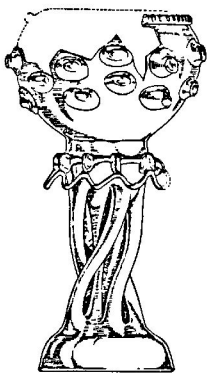
Fig. 6. Kuttrolf (højde ca. 19 cm) fra et jordfund i Esslingen i Vesttyskland. Her er tale om den hidtil bedste parallel til Ribe-flaskens krone af glastråd, og sandsynligvis viser den tyske flaske, hvordan halsen på Ribe-flasken har set ud. Ef. Gross 1984. 1:2.

En helt sikker parallel til Ribe-flasken lykkes det da også først at finde gennem kontakt