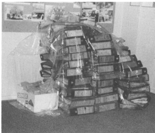
Aflieferingerne til de lokalhistoriske arkiver bliver større og større. Her 1/4 af det købmandsarkiv, der i 1986 blev afleveret til Vejen Lokalhistoriske arkiv.

I 1986 har arkivet/arkivlederen haft de samme aktiviteter som tidligere år. Udstilling: På opfordring gentoges »Vejen før og nu«, som sammen med læsestuebesøg gav 504 autografer i besøgsprotokollen lige så mange, der ikke fik skrevet. Lysbilleder og film er vist i forskellige foreninger, mest i Vejen. Grupper fra skolerne i byen har set udstillingen og arbejdet med de emner, billederne lagde op til. Mange telefoniske og skriftlige henvendelser er besvaret, og lyd-dias-serien