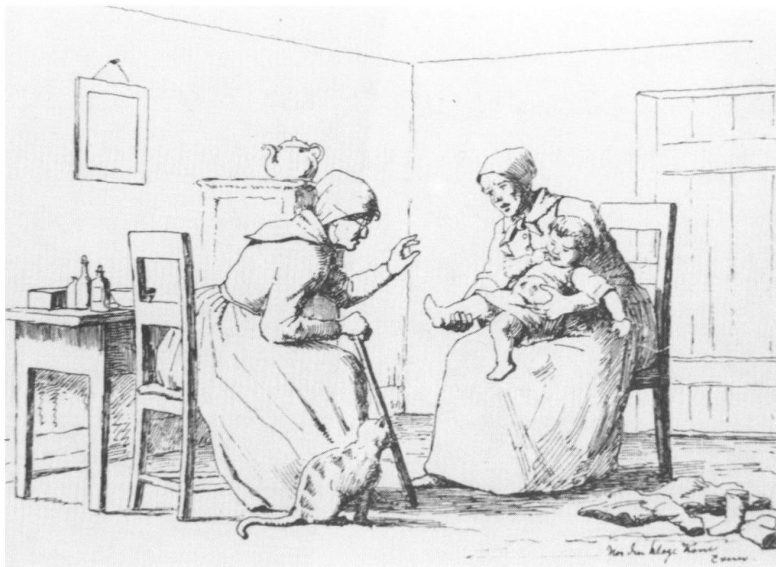
Den kloge kone havde en vigtig position i samfundet. Der var ikke læger til menigmand, og for øvrigt havde man nok mere tiltro til de kloge folk alligevel. Den kloge kone var samfundets læge, hjælper og rådgiver, og derfor uundværlig. (Tegning af Julius Exner »Hos den kloge kone«).

skal finde den afgørende forståelsesmæssige forskel mellem kirkens og befolkningens opfattelse af, hvad der er skadende trolddom. For kirken var magien djævelens værk, men for befolkningen var det nogle redskaber, der kunne bruges enten med god eller dårlig bagtanke - med en god eller en ond hug.