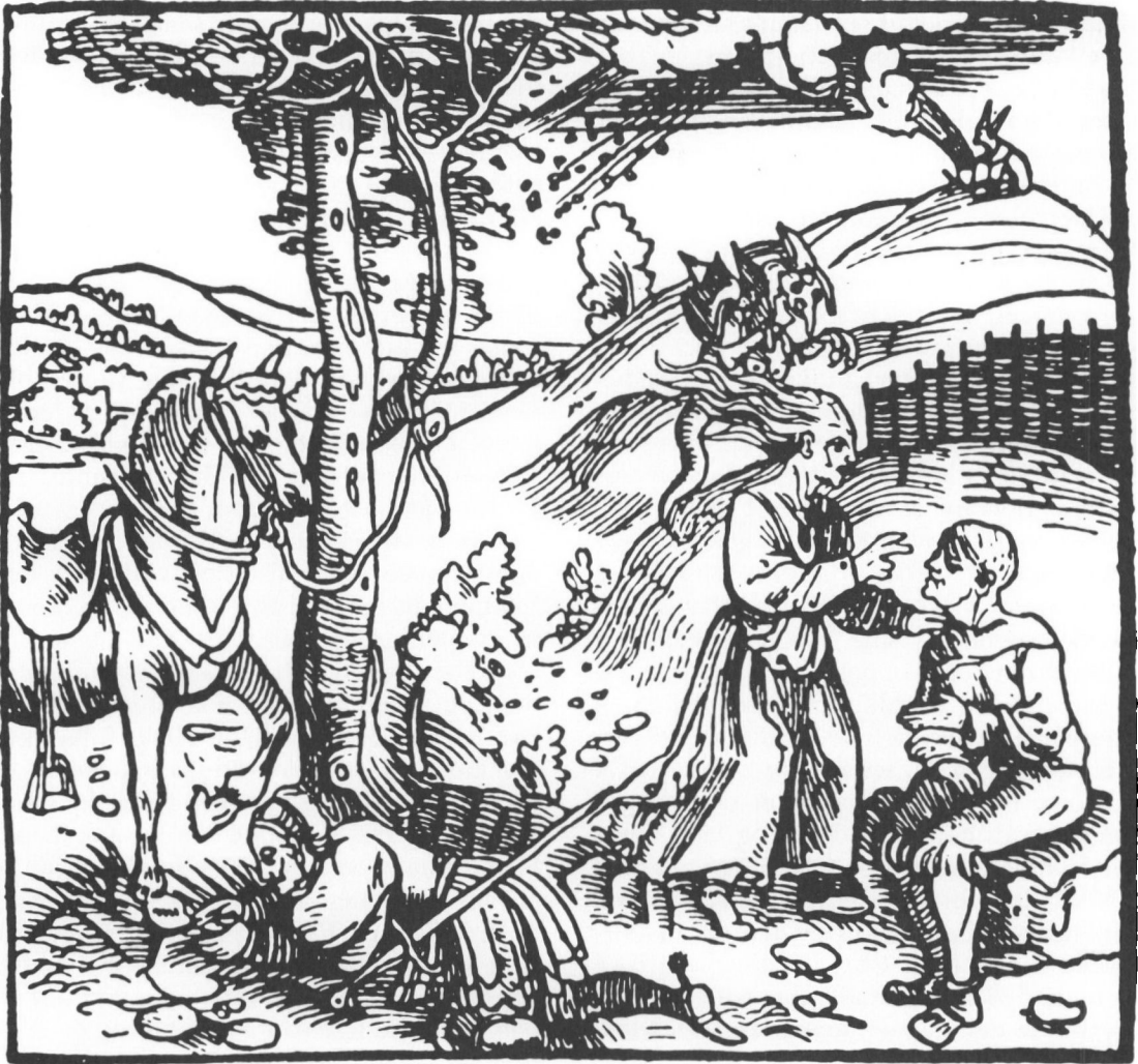
Troldkvinde igang med at overføre trolddom med håndspåleggelse og magiske tegn. Manden som trolddommen skal ramme søger at væge sig ved at lave korstegn med armene. I baggrunden ses kirkens indflydelse på folkemagien ved en djævel, der hjælper troldkvinden, og en anden der enten er igang med trolddomsbrygning, eller er ved at sende trolddom op i luften for at skabe uvejr. (Træsnit ca. 1500).