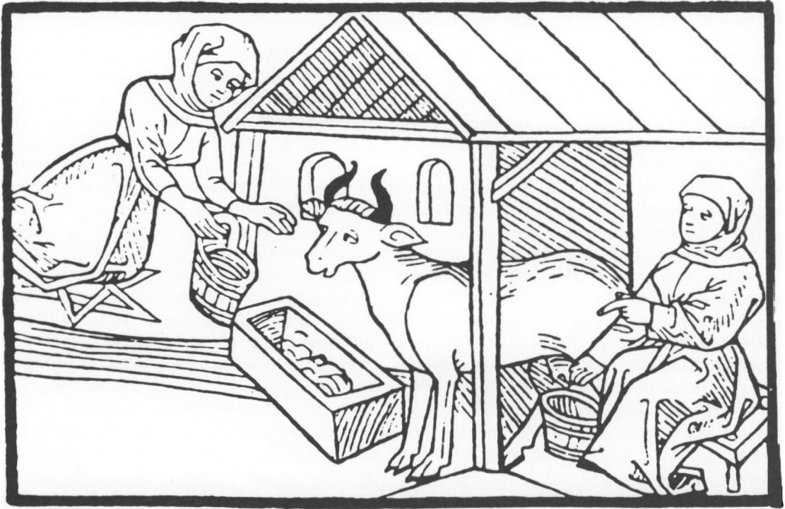
Mælk var et godt næringsmiddel – og derfor også et yndet mål for trolddom. Man kunne tage fløden fra mælken, eller man kunne tage mælken direkte fra koen, mens den blev malket, som troldkvinden til venstre er i gang med. (Træsnit 1486).

man skulle søge forklaringer på det uforklarlige, var det derfor også i disse grundelementer, man ledte.