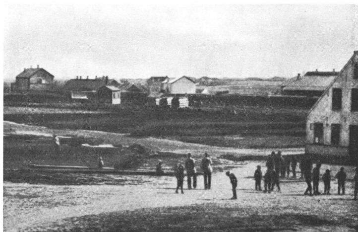
Fig. 1. Terrænet omkring nuværende Østergade og Jernbanegade sidst i 1880'erne. Skolen havde til huse i bygningen til højre, hvoraf kun en del af gavlén ses. I bygningens anden ende var der kaserne for gendarmkorpset. Skolens legeplads var pladsen udenfor, de to voksne er muligvis lærere, men kan ikke identificeres.