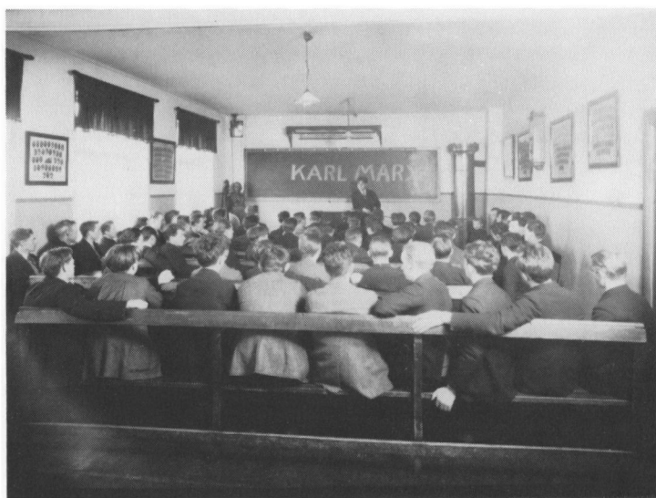
Fig. 6. Arbejderhøjskolens foredragssal 1928. Daværende forstander Julius Bomholt taler. – Som det ses på tavlen, var holdningen til socialismen blevet tydeligt mere afklaret i løbet af 1920'erne.