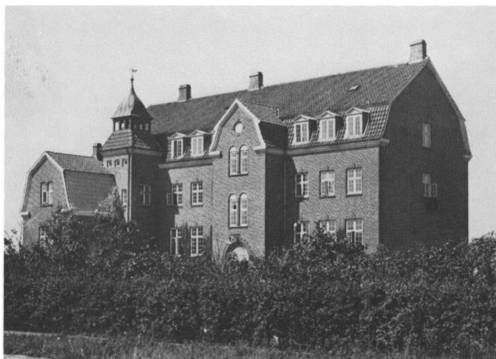
Fig. 1. Esbjerg Arbejderhøjskole, Gl. Vardevej 80, opført 1916-1917.

uden på nogen måde at ville missionere, var hendes fulde hjerte ved arbejderbevægelsen. Det var min fars også, selv om han en periode i 1890'erne havde været gårdejer. Da det havde vist sig ikke at kunne gå, havde mine forældre solgt den for at ende i Esbjerg, hvor min far blev ansat som maskinarbejder.