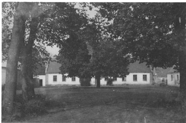
Fig. 1. Rugholms gårdsplads set fra indkørslen. Efter gl. foto. Friis Legardt Skov.