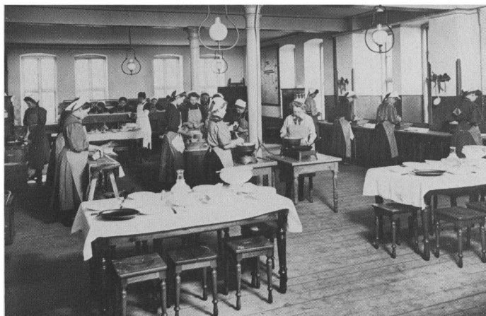
Skolekøkkenet på Stormgades skole fotograferet mellem 1903 og 1910.