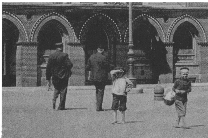
Et lille bybud med bare fødder på Torvet 1903.

nen havde pastor Bruun protesteret imod nedskæringen af timetallet i religion. Det gjorde han både som præst og som embedsmand, fordi han fandt, at det foreslåede timetal var i strid med cirkulære af 6. 4. 1900 og ophævelsen af brug af lærebog i strid med skoleloven af 1856.