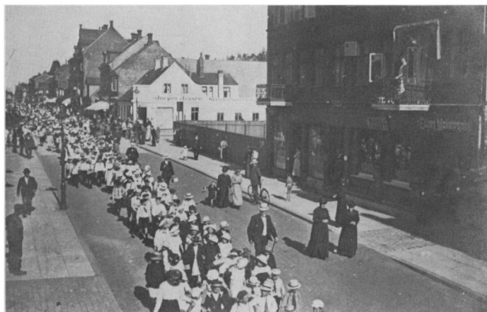
Skoleudflugt fra Danmarksgades skole til Ribe ca. 1915-20.

skiftesko, hvad de få børn, der havde lædersko, skulle gøre, skulle afgøres af skoleinspektørerne. Børnene legede på gader og veje, der nu var ved at blive brolagte og således næppe gav de samme legemuligheder som tidligere. Boldspilklubben var stiftet, men der var ikke noget klub- og foreningsliv, der omfattede de mindre skolebørn, og der var ikke noget fritidshjem. Skoleudvalget mente, at pladserne foran skolerne burde ligge frie og ikke bebygges, så de kunne anvendes som sports- og legepladser. 12