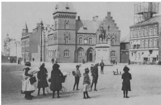
Skolebørn på Torvet ca. 1905. Et par velklædte drenge med tornyster, en barne pige og en pige med pakke under armen.