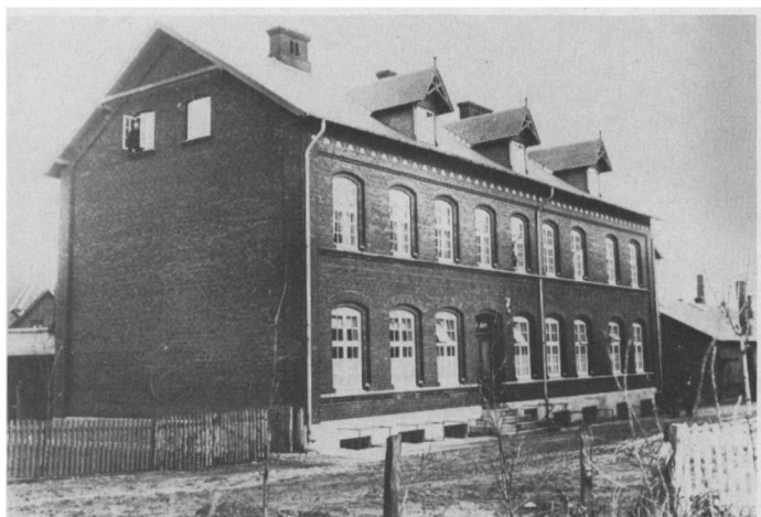
Vejen realskole, bygget 1900, (sidste dim. 1963). I dag nedrevet.

time blev afsnittet gennemgået - læst højt, nogle blev hørt i handlingen. Vi blev fortrolige med Oehlsenschlägers sprog, så blev det vor egen sag, om vi ved senere udvikling også kunne bliver fortrolige med hans lyriske storhed. - Således gennemgik vi folkeviser (Dronning Dagmars død), Holberg (Jeppe på Bjerget og Erasmus Montanus), Baggesen (Kallundborg Krønike, som jeg lærte helt udenad og så at sige kan endnu i min 81-årige alderdom), Blicher (Hosekræmmeren), Paludan Müller (Den ottende Kunst), Chr. Winthers »Henrik og Else« osv. Hjemme i dagligstuen sad jeg søndag formiddag og læste Holberg, og han kedede mig nu alligevel. Først ved at se ham på scenen, gik han op for mig i al sin storhed og morskab. Drachmann var den sidste i rækken med »Ole Pil«, som jeg syntes var grov og uskøn.