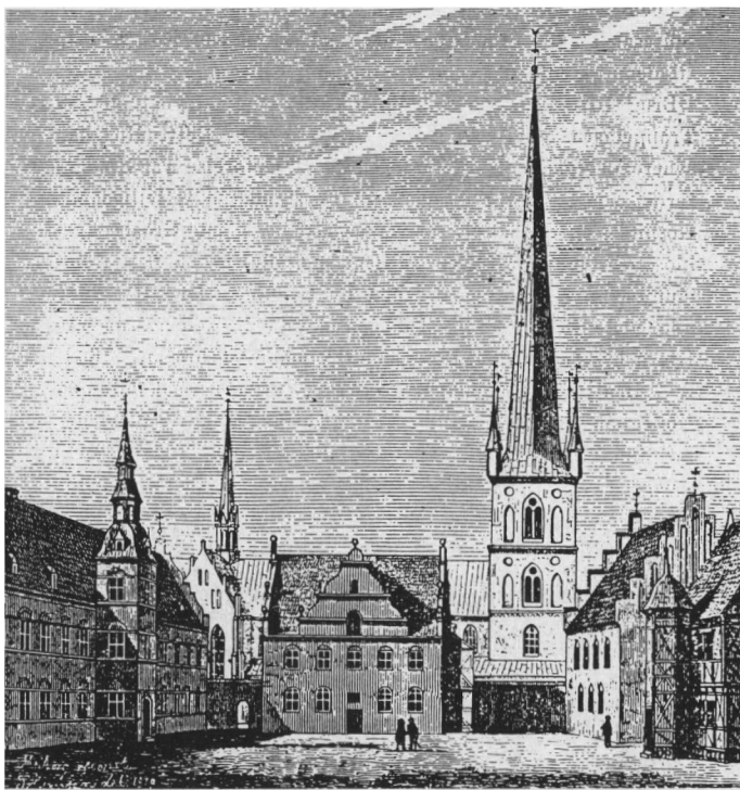
Studiigården i København i begyndelsen af det 17. århundrede.

(Fra Matzen: Universitetets retshistorie.)