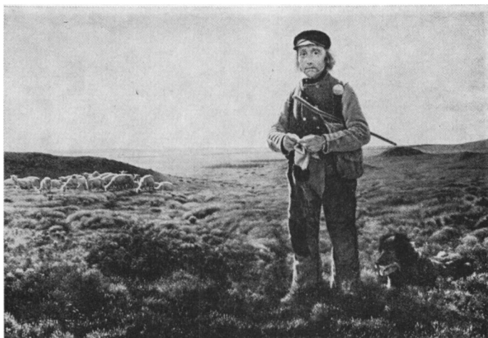
F. Vermehren: Fårehyrde på Heden. 1855. (Statens Museum for Kunst).

Om fårehold og -folde skriver Ole Højrup bl.a.: »Havde gården et stort hedearéal med mange »grønner«, det vil sige pletter, hvor der stod vand om vinteren, og som derfor var græsbevoksede, så var der betingelser for et stort fårehold. Endnu kan man hist og her støde på en lav ringvold i lyngen med frodigt græs bag volden. Her står man over for en af de folde, hvor fårene blev lukket ind om natten. Som regel lå folden nær agerjordens yderkant, således at man var fri for at drive fåreflokken ind mellem de dyrkede afgrøder, og i folden samledes der gødning, som var let at få kørt til de yderste marker, som det godt kunne knibe at få gødet hjemme fra gården«. 7