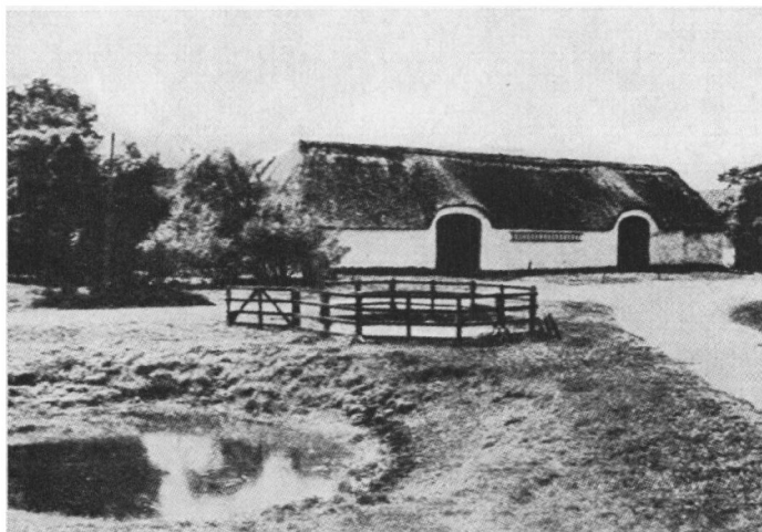
Markmandsfold ved gadekæret på bypladsen i Hillerup, Farup sogn. Heri indsattes de udenbys kreaturer, der blev fundet på byens marske.