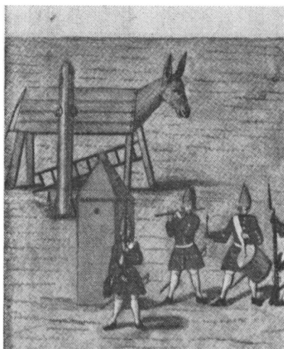
Udsnit af billede af hovedvagten ved Københavns slot i Frederik IV's tid. Bemærk træhestens store højde i forhold til soldaterne og straffepælen.

Den almindelige opfattelse er vel den, at træhesten havde fire ben, og således ses den også på det