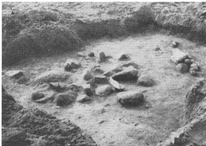
Fig. 1. Gravens øvre stensamling fra nordøst. Lerkarskårene fandtes mellem og under stenene mod øst. Muligvis har fodskålen oprindeligt stået ovenpå stendynge.

I foråret 1956 kunne Carl Nielsen imidlertid meddele, at han atter var stødt på en stensamling, den-