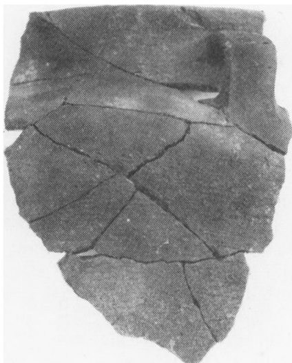
Fig. 1. Fragment af stort lerkar med båndformet øre og fingerindtryk i mundingsranden. (Højde 27 cm).

Hustomten lå som en omtrent øst-vestgående højning på toppen af et bakke­drag. Dens sydvestlige