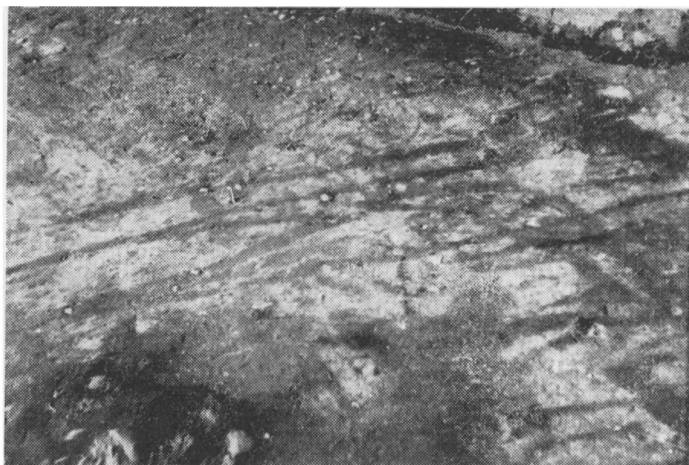
Fig. 4. Nærbillede af pløjesporene.

Spørgsmålet om oldtidsagrene og deres alder vil