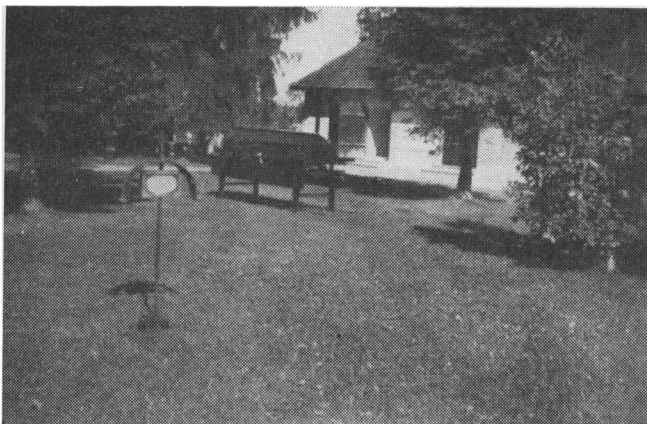
Begravelse i Leksand ved Siljansøen i Dalarne. Kisten stillet ud paa Kirkegaarden om Morgenens (1950).

Ligbaarer af samme Type, som vi kender den her i Landet, i Dalarne. Paa ovenstaaende Billede, som er taget i Leksand for et Par Aar siden af Tømmerhandler Klit i Agerbæk, ser man Kisten stillet frem paa en Ligbaare paa selve Kirkegaarden. Det skete tidligt om Morgenens selve Begravelsesdagen. De,