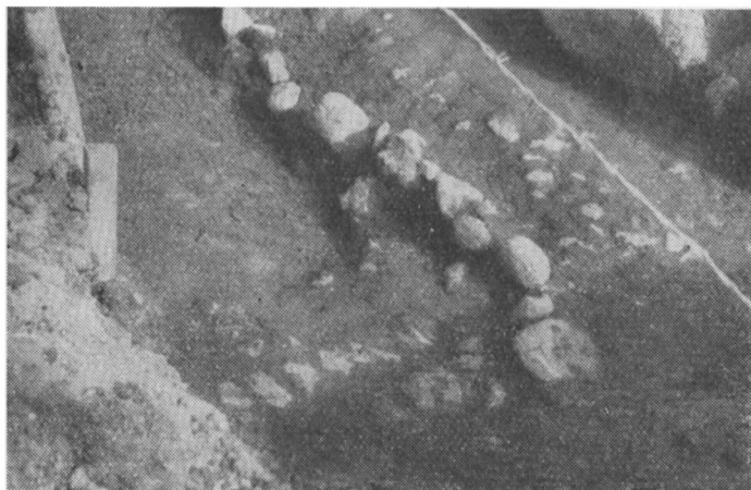
Kælderen i Veerst. Den sydlige stenbænk ses samt den bro-lagte indgang til den forsænkede midtergang.

I kælderbunden var der baade langs nord- og sydsiden en stenbænk eller hylde 76 cm bred og hævet