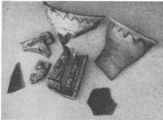
To skaar af det graa lerkar med bølgeornamentet. I midten den grønne kakkelflise med søjle og pil. Tillige 2 stk. grønt glas.

Naar denne ret svært byggede kælder med den