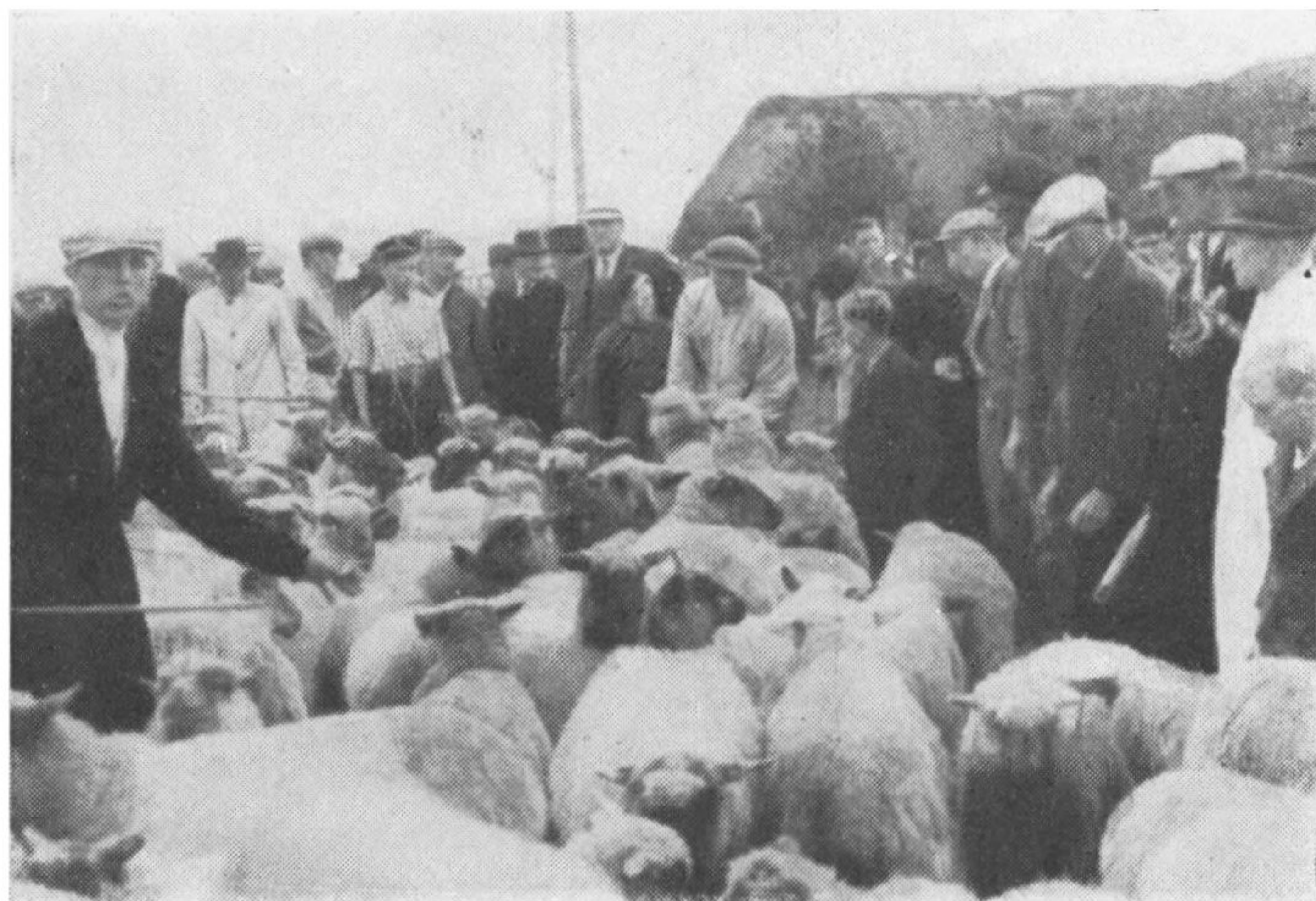
Faaremarkedspladsen ved Ho Forsamlingshus.

vasket og klippet. Saa kommer de atter paa Skallingen og bliver der til den 24. August, da de igen kommer hjem, og Faaremarkedet i Ho bliver afholdt. De Dyr, der ikke sælges, vaskes og klippes og drives paany ud paa Skallingen, hvor de nu maa gaa over det hele. Fra April til 24. August har de kun maattet græsse paa det østligste Arealer, den vestlige Del forbeholdes Kreaturerne.