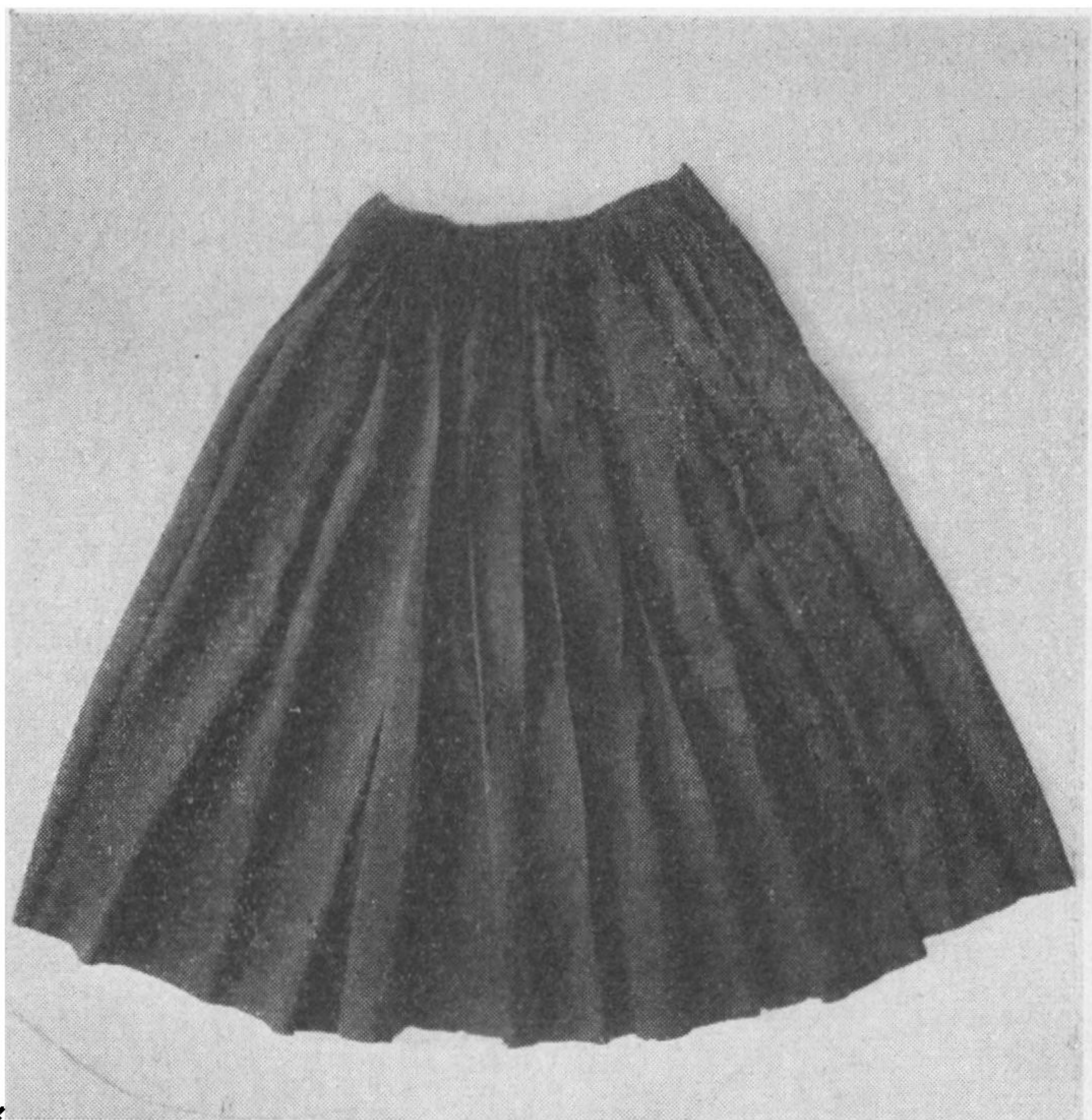
Fig. 4. Sørgeskørt fra Varde-egnen, „jupe“, af fransk jupe (= skørt). Svarende til Amager „jøb“. Skørtet blev båret over hovedet ved begravelser. Nationalmuseet.

Brudedragt. Brudens hovedpynt hed »æ smyk«. Det bestod af en tyk krans af kulørte tøjblomster med en rød sløjfe bagtil. Senere blev denne sløjfe hvid, men hvis brudgommen var enkemand, skulle sløjfen være blaa. I 1860erne erstattedes blomsterkransen og sløjfen af myrtekrans og slør, der først kun naaede til livet og var af fint, hvidt, hjemmewævet lærred. Man lejede æ smyk hos modehandlerinden. Naar bruden havde danset første dans med brudeføreren, tog konerne æ smyk af hende