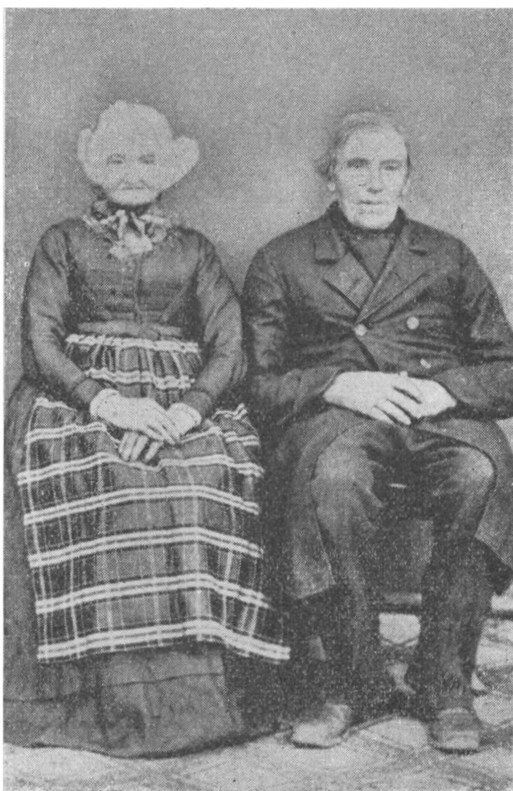
Fig. 3. Mands- og kvindedragt fra Gredsted, Gørding herred ca. 1860 -70. Efter gammelt fotografi. Nationalmuseet.

gøre, det griner de bare af her«. »Krammer« eller »gjord« paa træskoene brugtes mest af børn og fattigfolk.