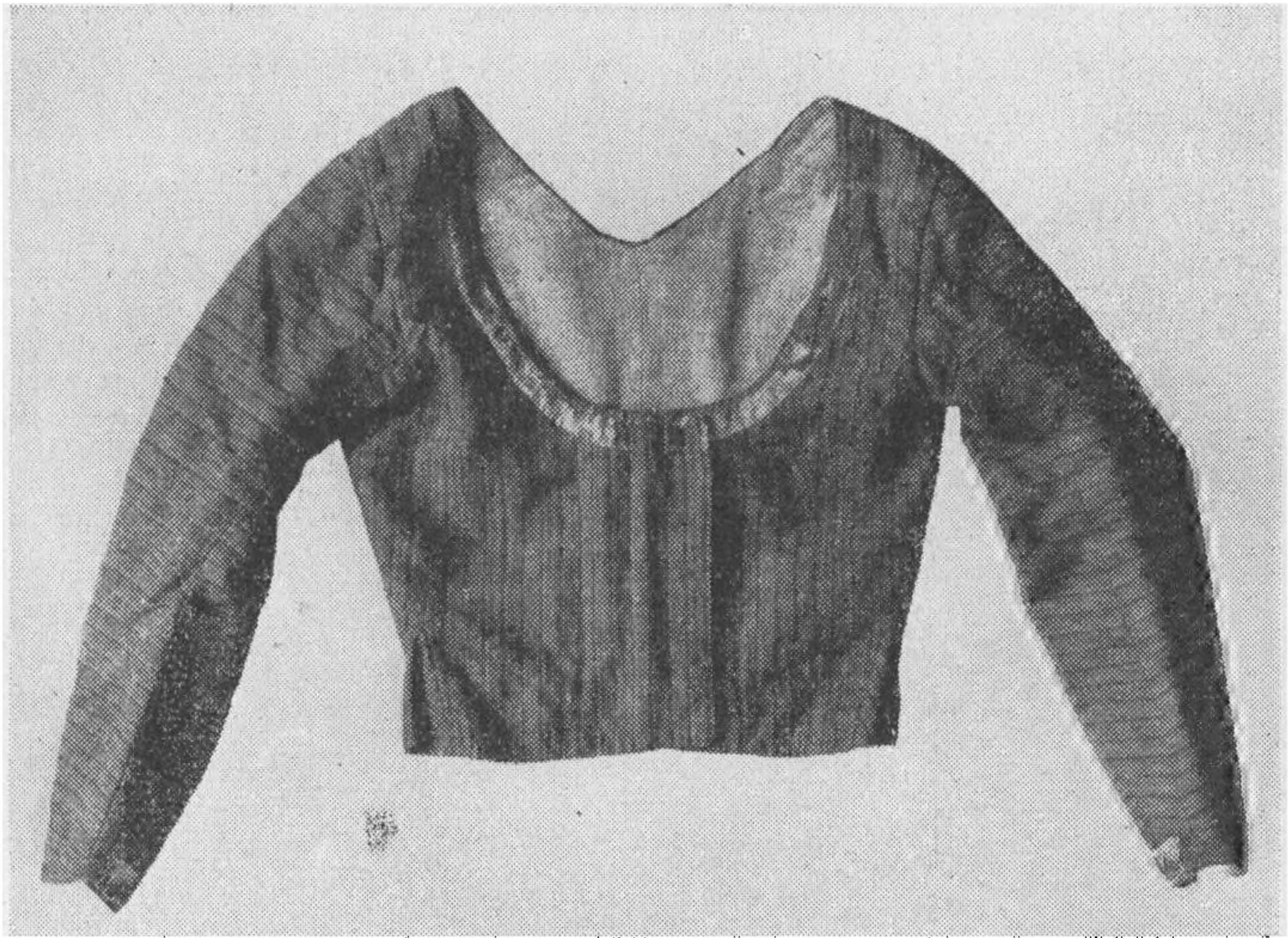
Fig. 2. Ærmeliv fra Darum, Gørding herred. Af rødt hvergarn med smalle, blågrønne striber. Kantebånd af gul silke. Omkring 1800. Nationalmuseet.

eller hvergarn, d. v. s. uld og hørstof. Om vinteren vadmel, d. v. s. hel uld. Et særkende for Ribe amt (og Sønderjylland) er tosel med silkestriber, der omtales i 1815. Til alters og »henføllen« brugtes mørkeblaa umønstrede hvergarns kjoler, kaldet »slet tøj«. Til begravelse bar man sort »orleans«. Det sidste var ogsaa »til kønhed«, som det kaldtes. Til dette brug kunne dog ogsaa anvendes sirts, mens silke eller damaskes klæder var sjældne. Ved indledning efter barselfærd var alle mødre klædt i sort, og konfirmandinder havde sort slæbekjole og sort hovedpynt.