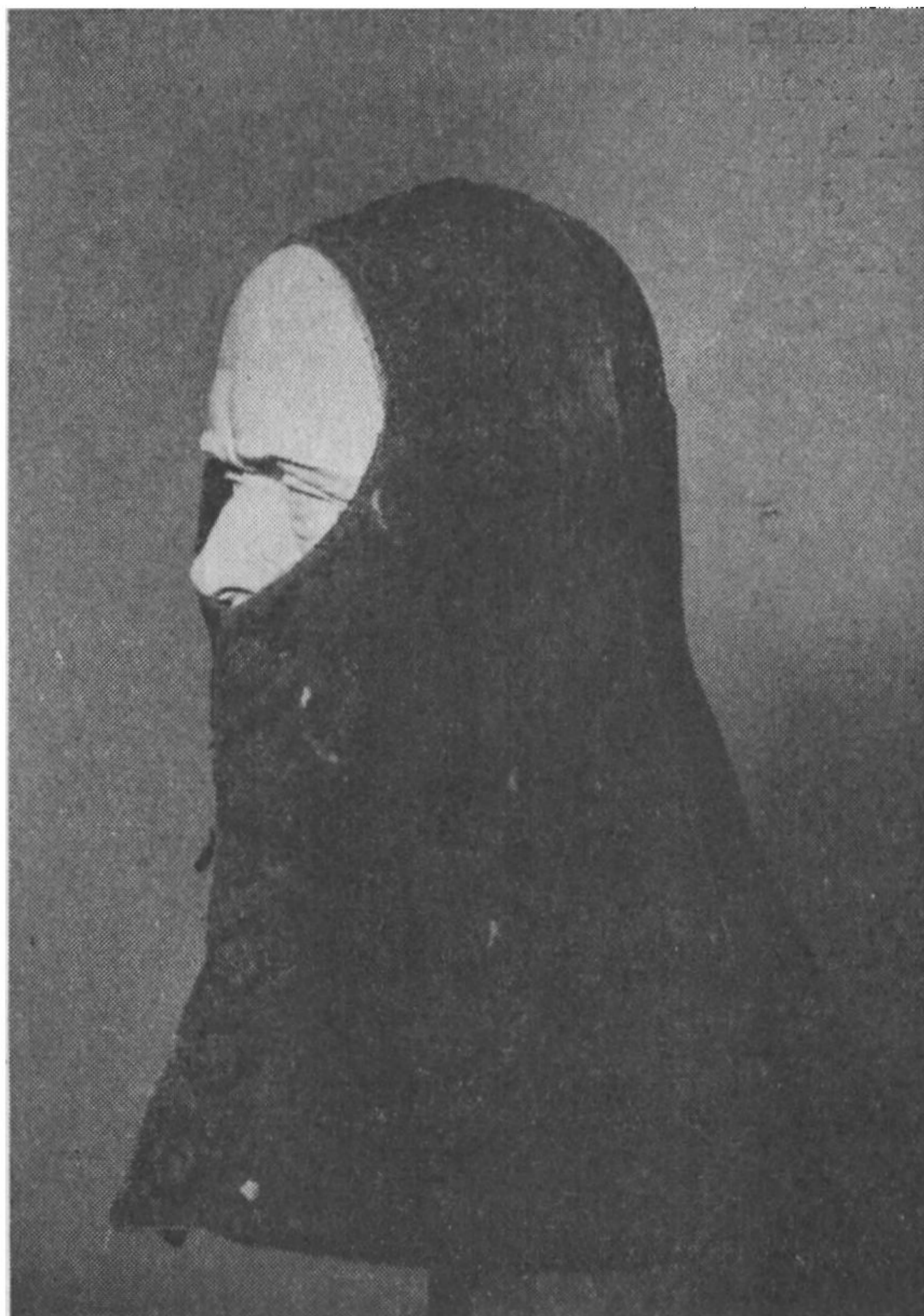
Fig. 6. Hætslag af blåt vadmél. Fra Brørup sogn, Malt herred.

1875 begyndte mændene at bruge hvidt kravebryst. Naar man havde kravebryst paa, skulle den øverste og nederste knap i vesten være knappet, mens de øvrige skulle staa aabne.