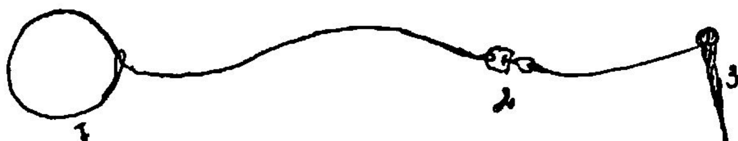
Haresnare af Messingtraad.

en Hare, der kom springende eller løbende for at komme ind i Kaalene, kunde faa Hovedet ind i Løkken, der da straks løb sammen ved Trækket,