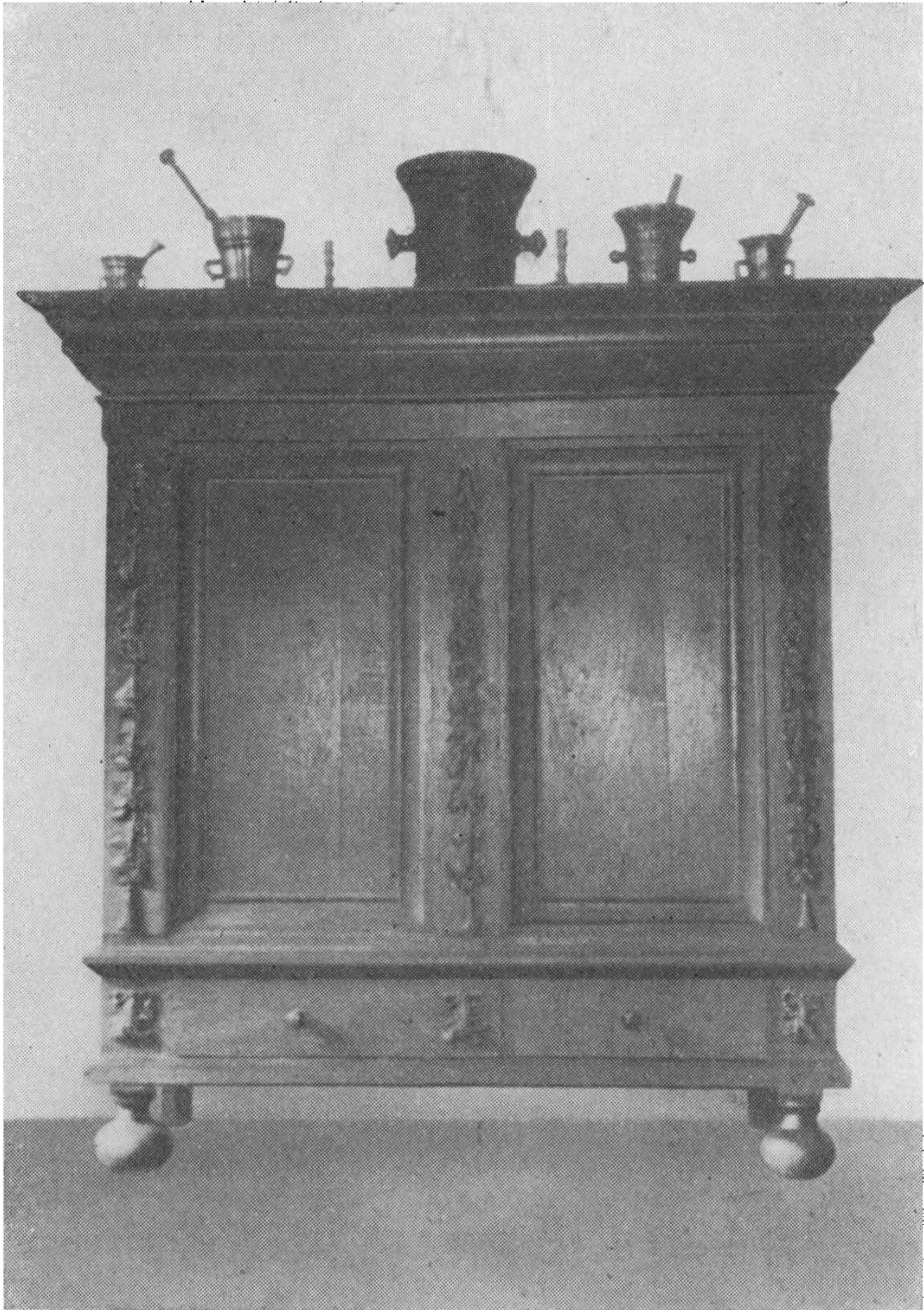
Barokt Linnedskab fra Endrupholm.