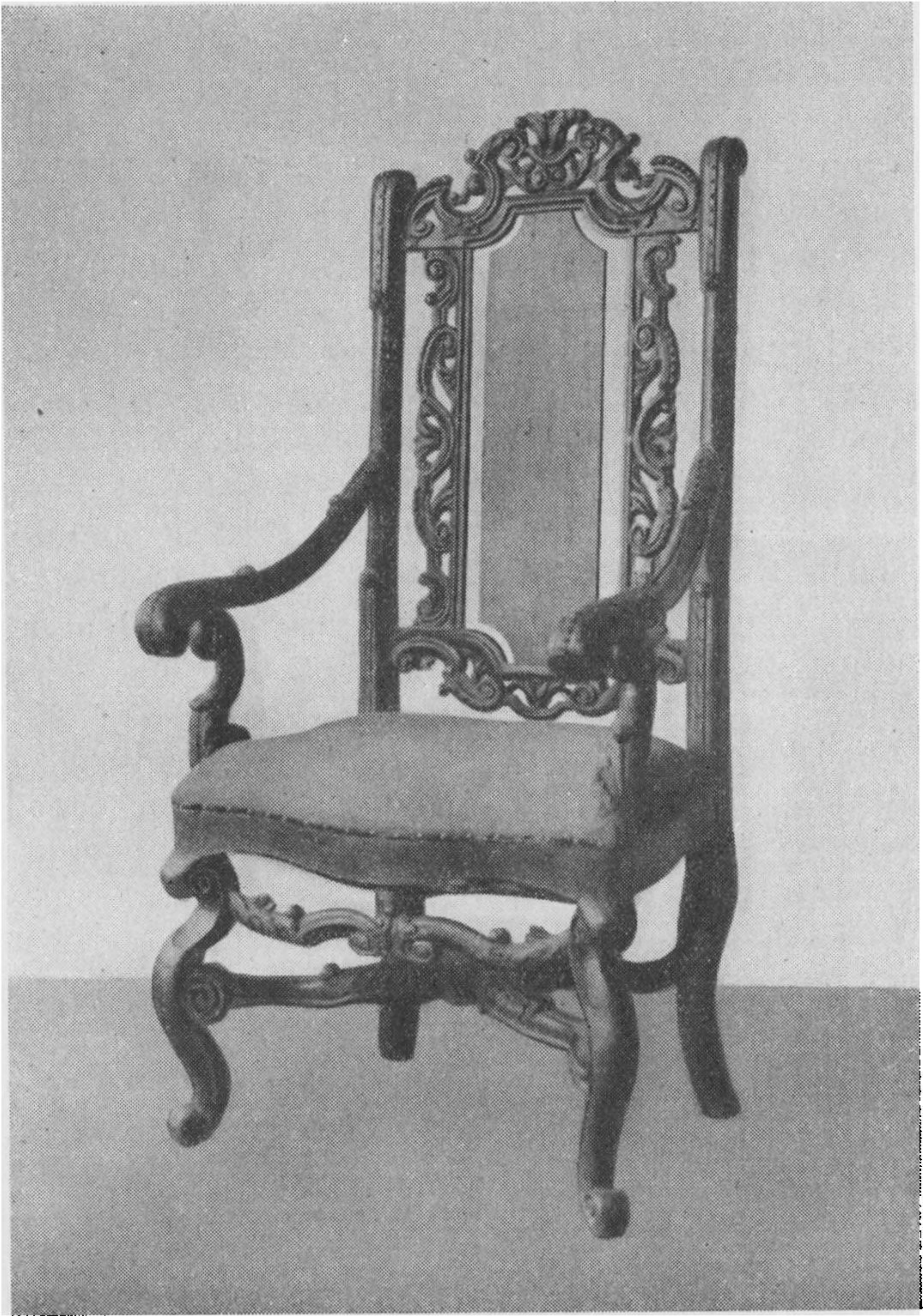
Stiftamtmand Gabels Stol fra Bramminge Hovedgaard.