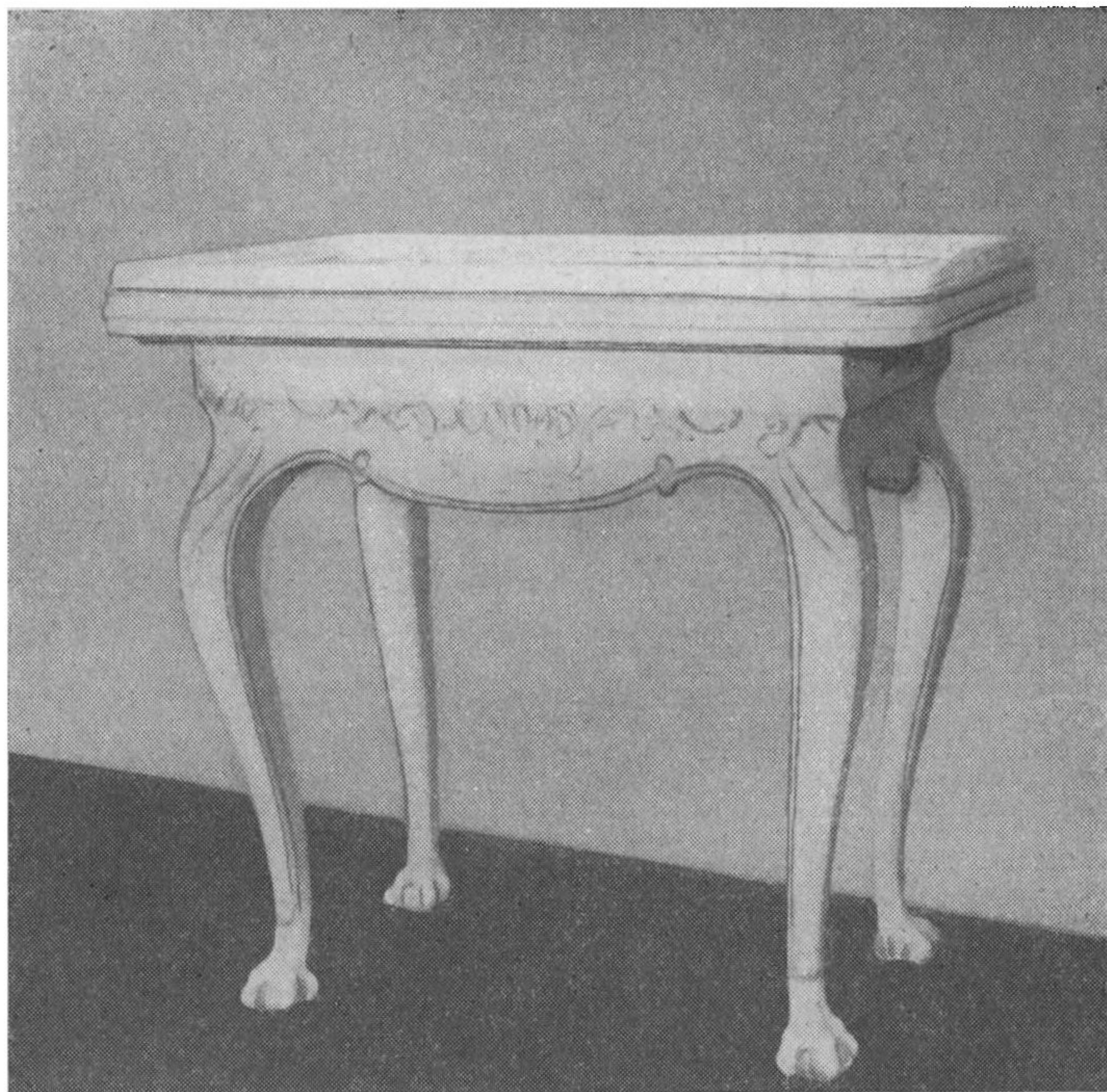
Rokokobord (Bakkebord), slesvisk Fajance.

brudte Ryglæn svajes lidt, saa Stolen bliver langt mere behagelig at sidde paa end tidligere Tidens stive Stole. Rygfjælens Konturer er oftest usymmetriske, og det samme gælder det udskaarne Midtparti af Kopstykke og Sargens Forrigel. En Stol af denne Type med udskaaret skæv Muslingeskal paa Kopstykke og Forrigel har Museet faaet fra Gjellerupholm.