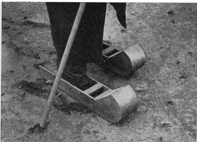
Mudderskøjter eller Vadesko.

Helt inde i det inderste af Hobugten, op mod Ho,