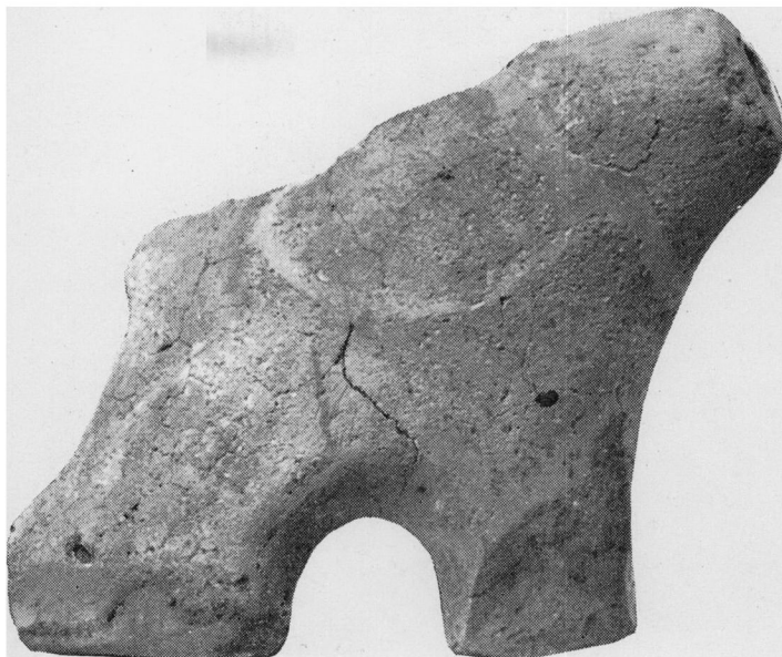
Fig. 1. Skaar af Ildbuk fra N. Nebel. Hornet set fra Siden. 9/11.

Endnu en oval Aabning har der været i Væggen, som Bruddet gaar igennem. Det ses paa Fig. 1 i Randen yderst til venstre og paa Fig. 3 til højre. Bag ved Hor-