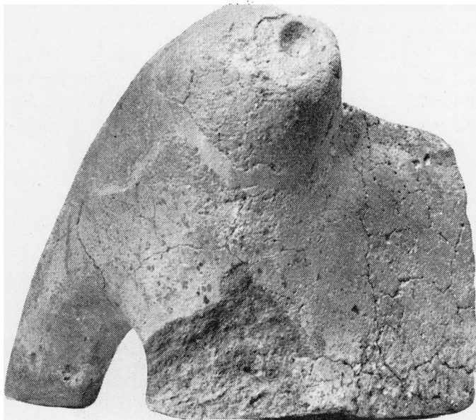
Fig. 2. Skaar af Ildbuk fra N. Nebel. Hornet set forfra. 9/11.

sidet, indvendig hul og meget tykvægget Genstand. Foroven har den en svagt indbuet Flade, der afsluttes i noget fremspringende, afrundede Hjørner, altsaa svage