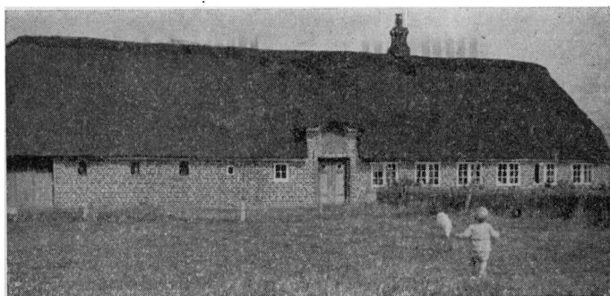
Typisk Mandøhus. Det findes nu ikke mere, men er først forsvundet for faa Aar siden.