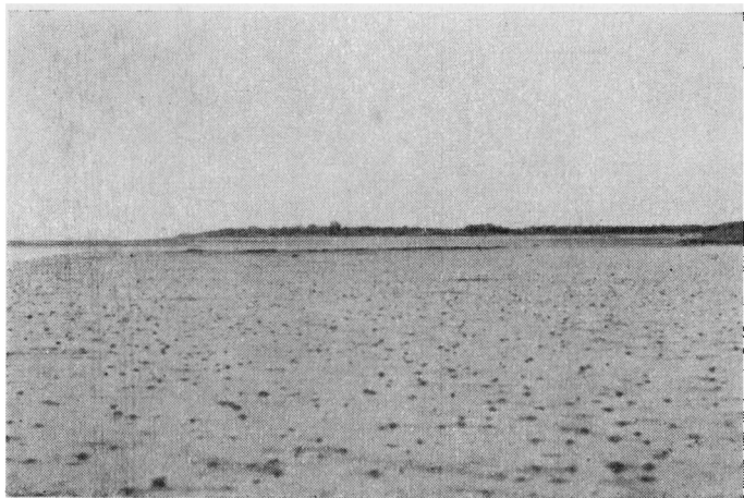
»Vedder« paa Sandflak ved Fanø.

det igen, derfor gælder det om for Ormegravnerne at have Øjnene med sig.