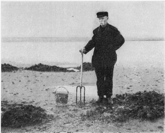
Gammel Ormegraver i Sædding Grøut med tretenet Gravegreb og Gravespand, rummende Orm til 2 Bakker.

den dygtige og drevne Ormegraver give den svagere og mindre dygtige en Haandsrækning. Og for at opmuntre de unge yderligere var der den Regel, at Kongehvillingen, den største Hvilling paa et Baadlaugs Havtur, tilfaldt den Graver, paa hvis Bakke den var fanget; det gav jo Mod og ansporede til at anstrenge sig for at faa gode Orm. En Bakke, der var eset med gode, tykke Orm gav som Regel flere Fisk end én, der var eset med tynde Orm. Naar Ormene var gravet, skulde Graverne til at traske hjemad med en sandet Klitvej eller Hedesti de 1 til 2 1 / 2 Mil. Nogle bar Ormene i den Spand, de var opsamlet i eller ogsaa i smaa Spande, saa de havde én i hver Haand, andre bar dem i en Rygkasse, og de vilde helst have en Kæp