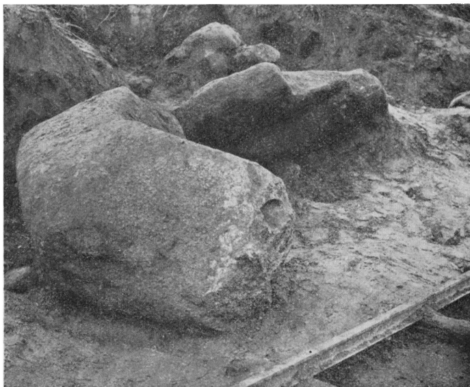
Graven set fra Nordøst.

Saaledes skulde Kamret have haft 5 Sidesten, af hvilke de store — som de bevarede viser — ikke har