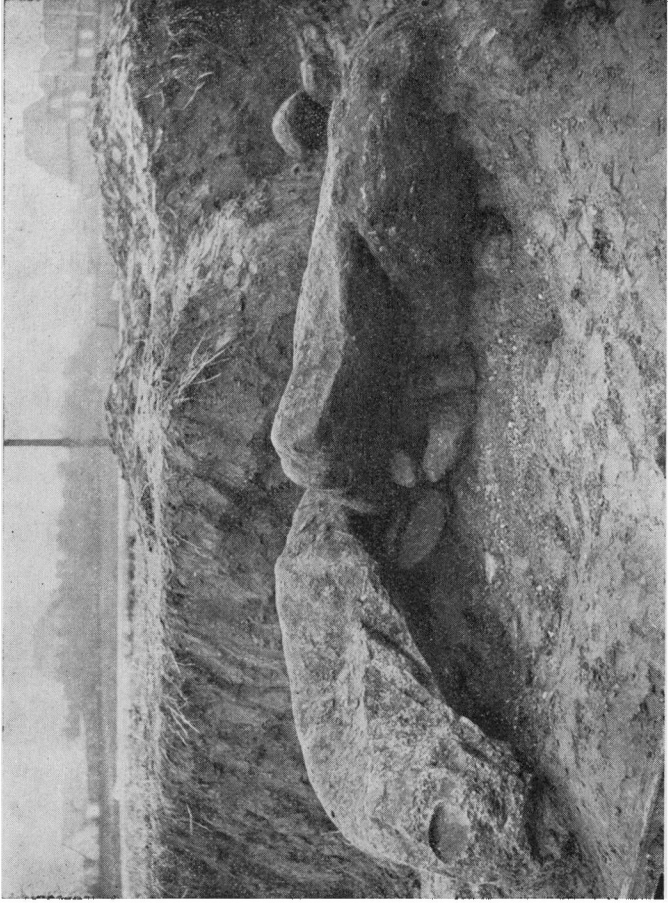
Graven set fra Nordvest tømt for Indhold.