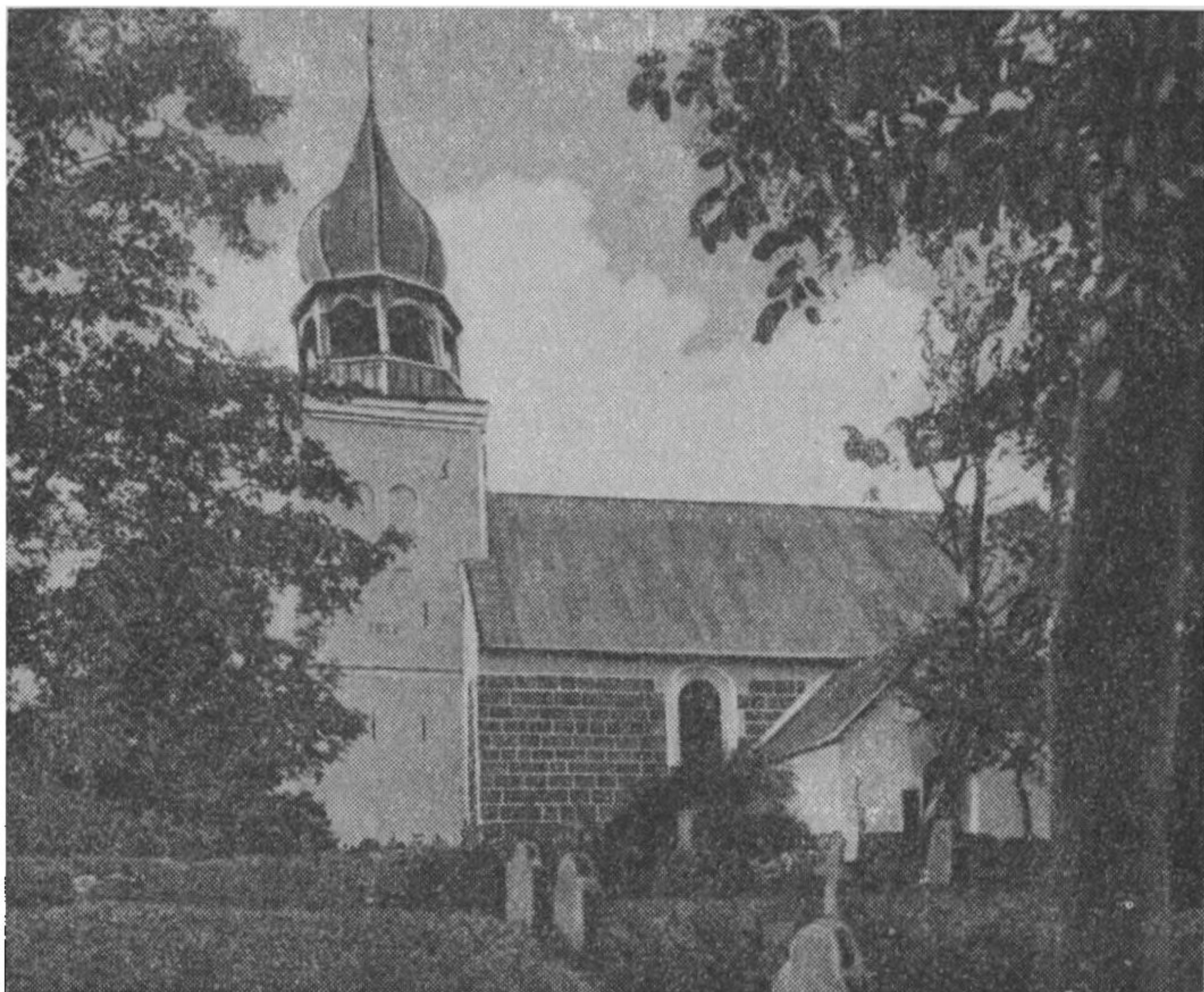
Fig. 1. Andst Kirke.

bildning af en siddende Kristus mellem to andre Figurer. Vaabenhuset, der er opført af Munkesten, er en senere Tilbygning. Ved Indgangen til Vaabenhuset er der indmuret en ejendommelig middelalderlig Gravsten. I Stenen er der udhugget et Ægtepar, neden under dette en Ko eller Kalv. Lignende Gravsten findes paa Fjenneslev Kirkegaard.