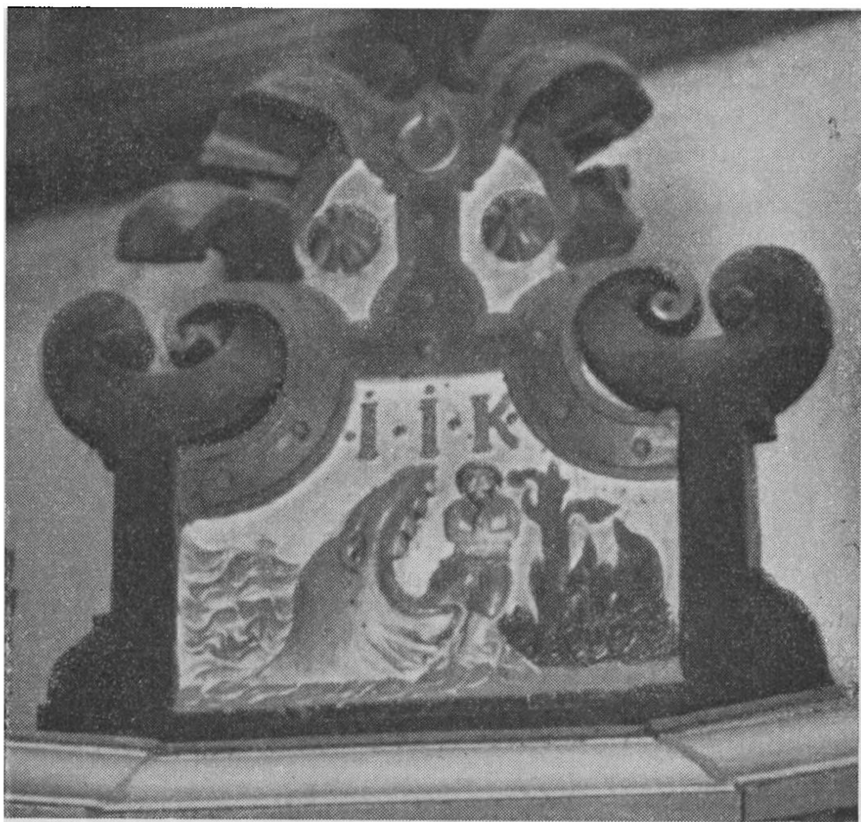
Fig. 3. Felt af Himlen over Prædikestolen. Jonas frigøres af Hvalfisken.

Paa en diskret og dog til sene Tider talende Maade har Præsten her mindet om den svære Tid, han oplevede, da hans Proces førtes for Konsistoriet. Meget havde han villet, meget var naaet gennem hans Flid og Indsats, han havde ikke sparet sig selv — og saa saa han, at Lønnen blev — som Verdens Løn saa ofte bliver over for dem, der rager op over det almindelige — Utak. Med nogen Bitterhed har han funderet over, at hans ærlige Stræben i uegennyttig Hensigt skulde lønnes paa den Maade, medens andre, der lader alt