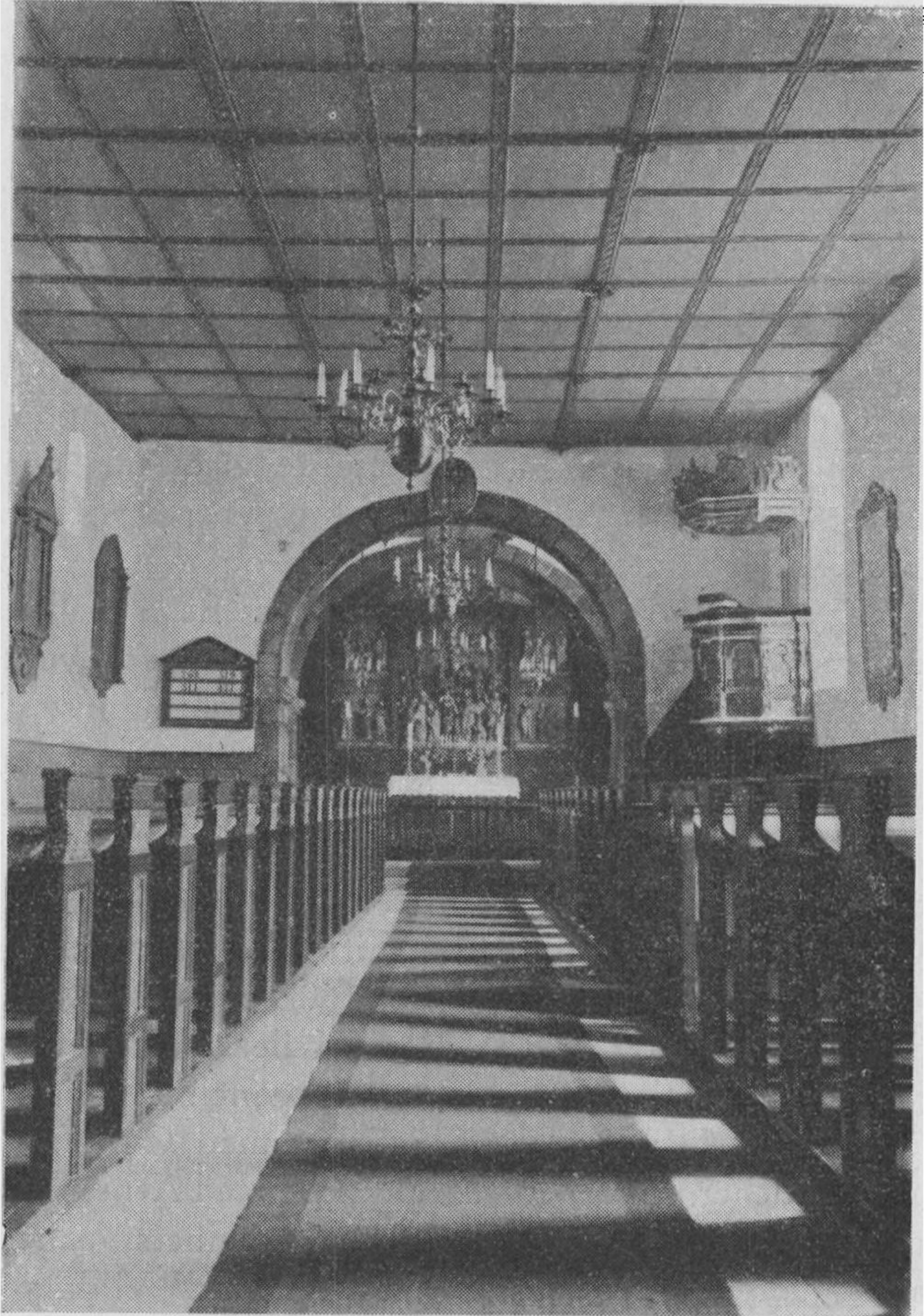
Fig. 2. Andst Kirke indvendig.