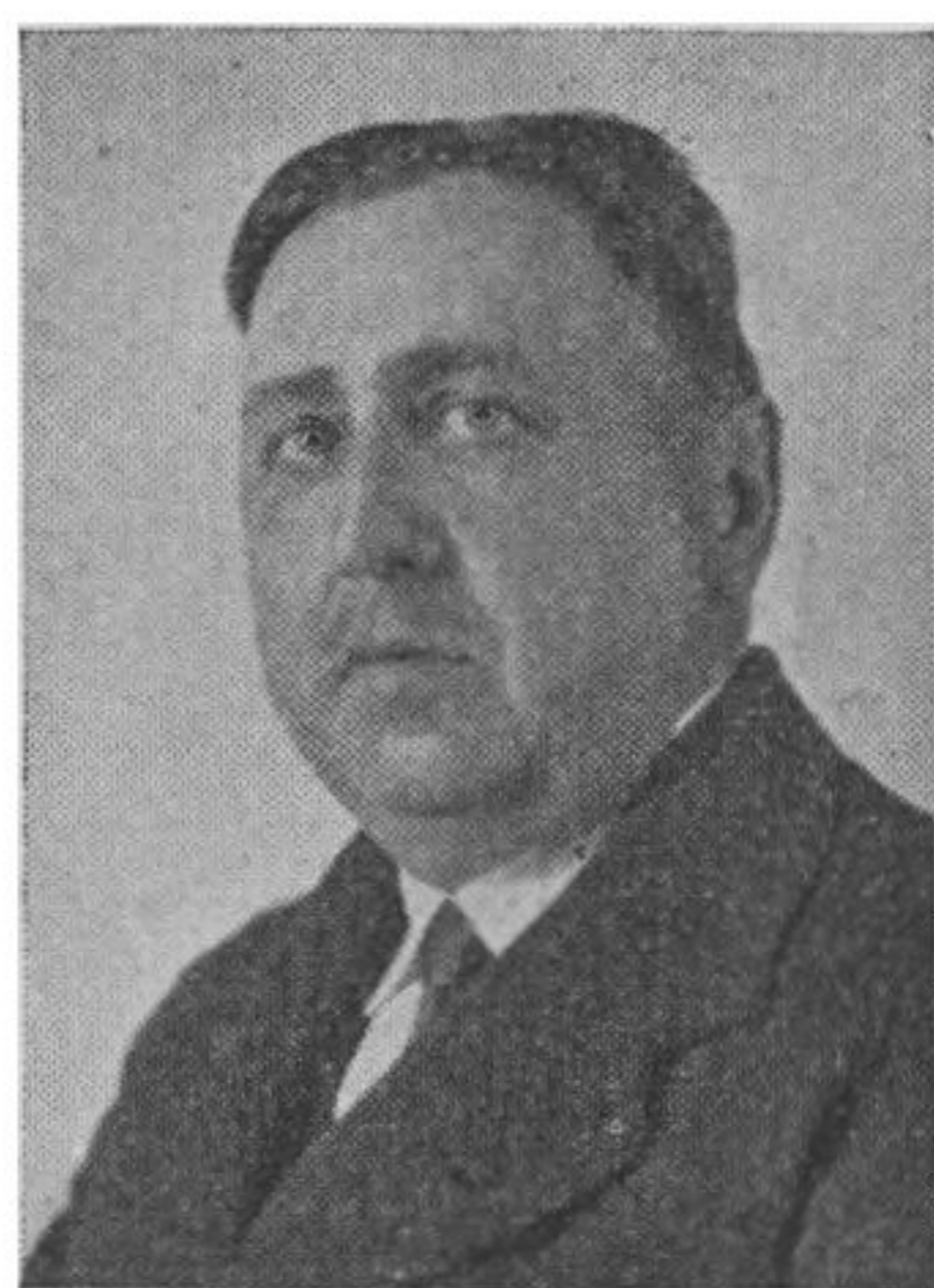
Dir. Chr. Emborg.