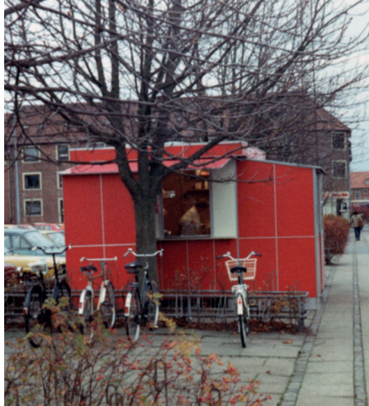
Nørregade mod Jernbanegade. Den nye pølsevogn, december 1980.

For begge mine forældre var salget af pølsevognen alligevel en utrolig overgang. Den havde været rammen om det meste af deres dag i 18 år. Det siger noget om, hvor stort behovet var for at få sagt stop, at de ikke på noget tidspunkt derefter kom til at savne den, eller fulgte videre med i dens skæbne. Pølsepriserne hørte helt op med at have interesse. Museumspladsen var et over-