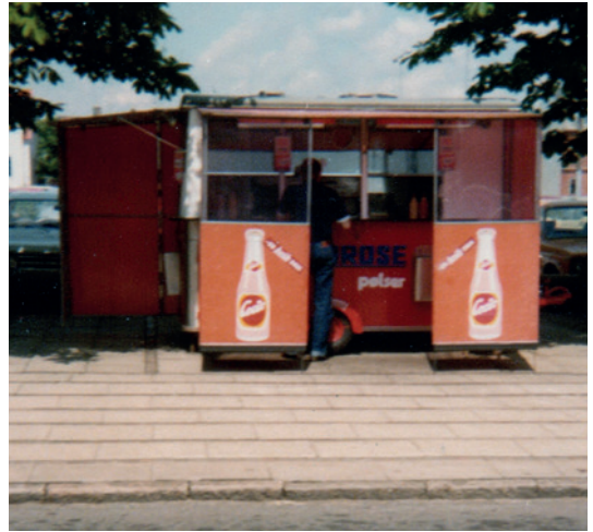
Pølsevognen på Museumspladsen, sommeren 1979.