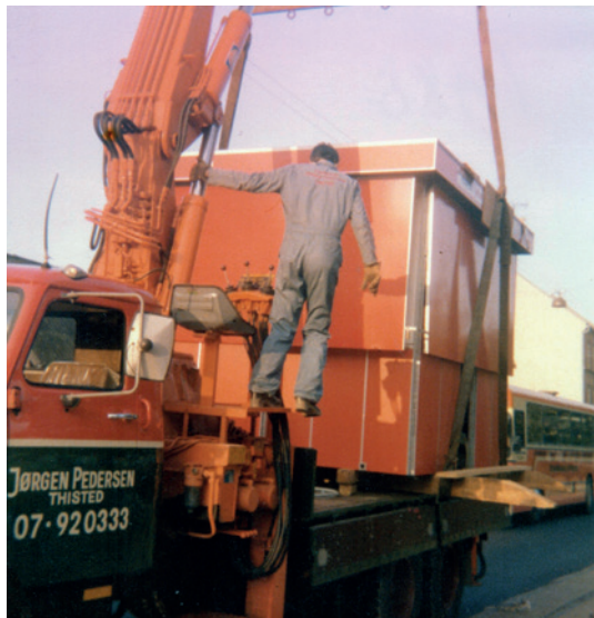
Den nye pølsevogn ankommer fra Vildsund til Museumspladsen, oktober 1980.