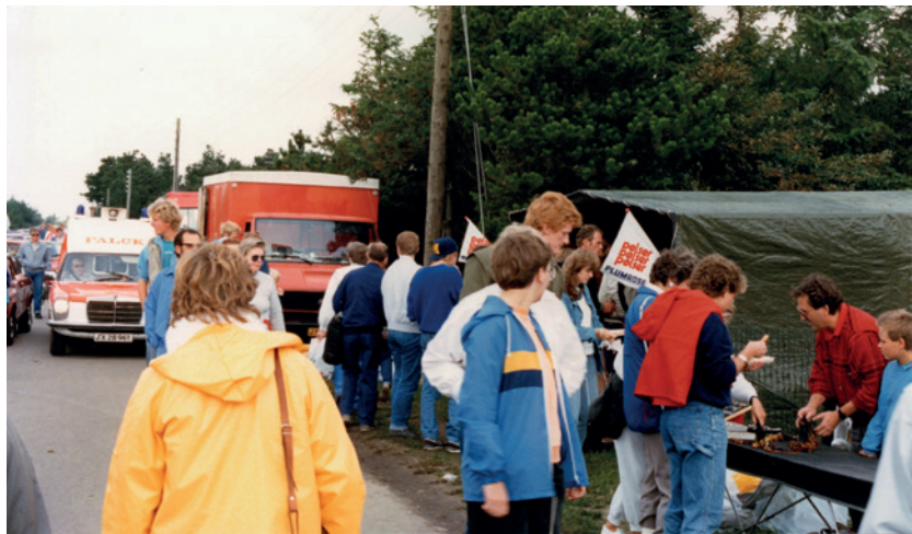
Mængder af mennesker og biler under Ho Fåremarked august 1986. En ambulance forsøger at komme frem. Kø foran pølseboden til højre i billedet.