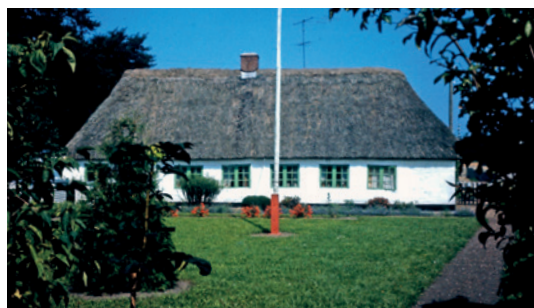
Varming Vesterby 19 i dag, hvor der er bygget flere fag til i den vestre ende. Bemærk, at vinduesfløjene er hængslede på midtersprossen på gammeldags manier.