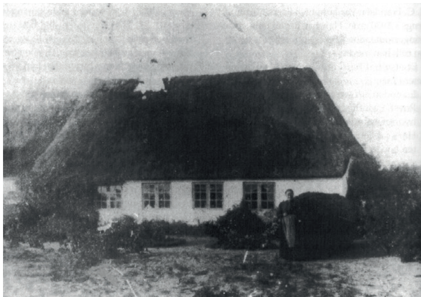
Ejendommen i Varming, hvor familien boede gennem flere generationer fra 1847 til 1929. Huset var på private hænder, men grundstykket tilhørte Seem Kirke, som årligt modtog en beskedent sum i leje.